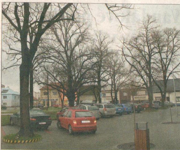
Lípy před městským úřadem možná už letos nezůstanou v plném počtu. Dvě z nich zřejmě budou pokáceny.

„Ty stromy tam rostou už mnoho let a dříve nikdo neuvažoval o tom, že by se měly kácet. Podle nás nejsou žádnou překážkou ani parkujícím vozidlům, rozhodně mají své opodstatnění, třeba i kvůli zadržování prachu, který se šíří kvůli frekventované dopravě,“ uvedl předseda místního sdružení Zelená pro občany Zdeněk Forejt. Okolo čtyř lip je po revitalizaci vydlážděná plocha s vyznačenými parkovacími místy. Kvůli stromům ale na několika