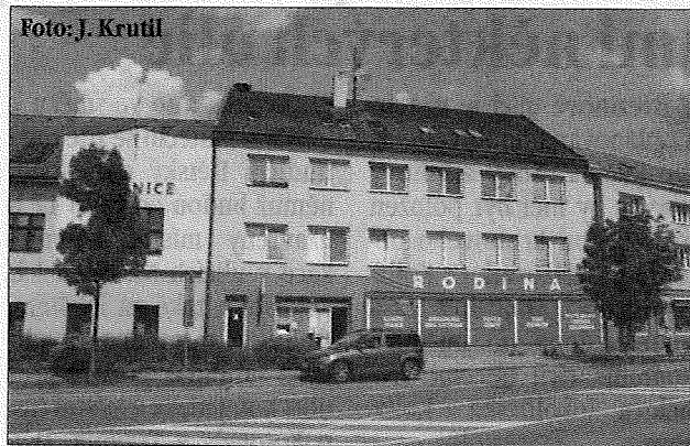
Projekt společnosti FORT-KM s.r.o. přinese budově novou podobu i energeticky úsporné řešení.

Autorem projektové dokumentace je firma GAZO s.r.o. -lk