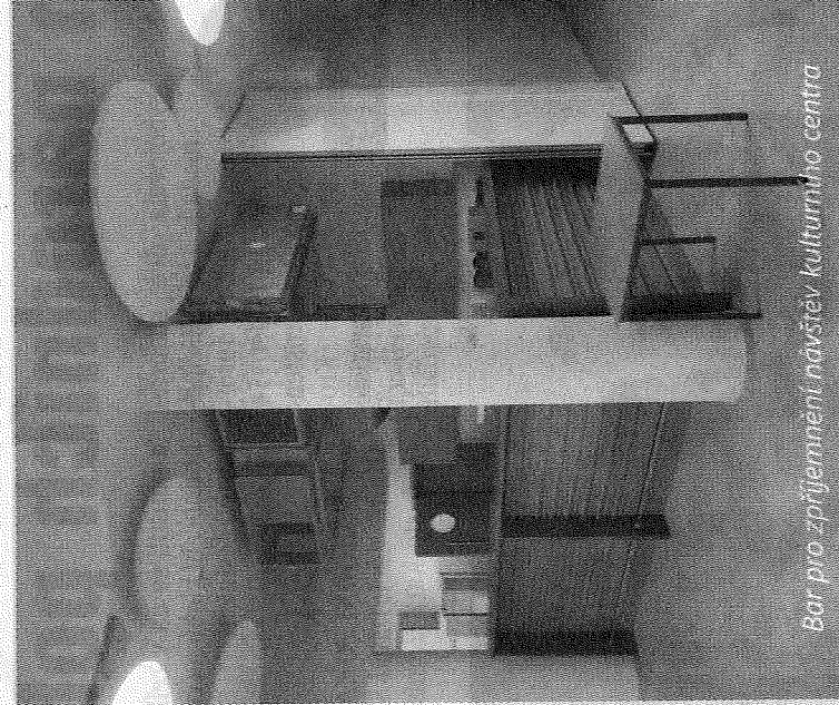
Bar pro zpříjemnění návštěv kulturního centra

Z nového Kulturního centra máme velkou radost. Nebylo jednoduché takto složitý a finančně náročný projekt zrealizovat, i s ohledem na prudký růst cen materiá-