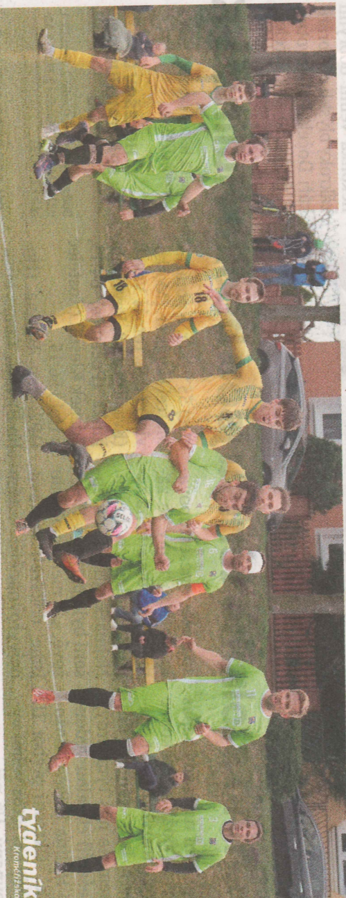
Bezměrov (ve žlutém) doma dokázal potrápit favorita ze Strlílek.

• Okresní trávníky v uplynulém kole 8. ligy nabídlý podívanou, která přepisovala historické dlouholeté statistiky. Zatímco některé potvrdili roli neotřesitelných suverénů, jinde padaly lehké bariéry a fanoušci se dočkali překvapení, na která čekali dlouhé roky. Hlavním tématem zůstává neuvěřitelná forma Hulína. Ten protáhl svou sérii neporazitelnosti už na sedmáct utkání v řadě. Slavkov p. H. odjel s debaklem 0:7.