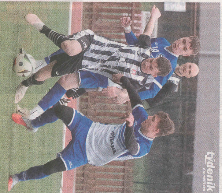
Hulín (v modrém) si i přes nepovedený úvod doma poradil s Břestem.