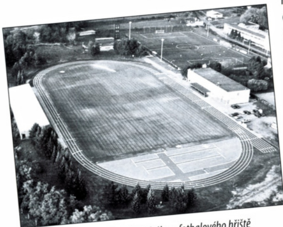
Rekonstrukce atletické dráhy a fotbalového hřiště ve Sportovním areálu Hulín s nákladem 16 a půl milionů je největší investicí roku 2007.