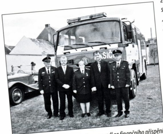
Nákup nového cisternového vozidla se povedl za finančního přispění Zlínského kraje. Celková investice představuje 6 a půl miliónu korun.