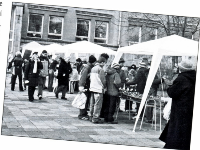
Žáci a učitelé ZŠ Hulín

V posledním adventním týdnu se konal na ZŠ v Hulíně tradiční „Vánoční jarmark“, letos jubilejní – desátý. Dopoledne žáci naší školy vyráběli nejrůznější drobné dárečky a ozdoby, které odpoledne prodávali za symbolickou cenu. Výtěžek celé akce bude rozdělen na dobročinné účely. Samozřejmě nezapomeneme ani na naši adoptovanou dívku z Indie, které už druhým rokem zasíláme finanční částku na její vzdělávání, popř. lékařskou péči.