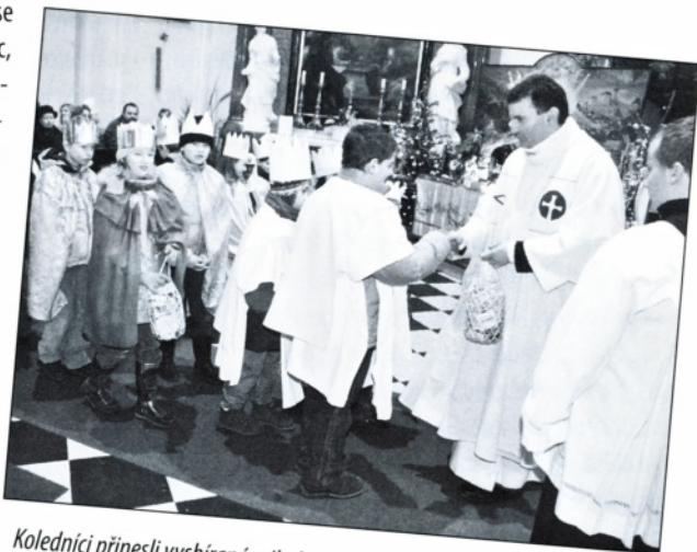
Koledníci přinesli vysbírané milodary na svatou mši do kostela sv. Václava.