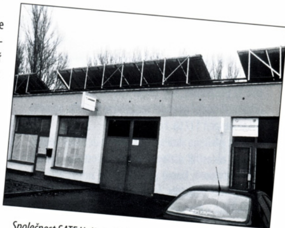
Společnost SATE Hulín instalovala na střeše budovy, v níž sídlí sluneční kolektory, které poslouží na ohřev teplé vody.

V soutěži o nejlepší fotografii pro měsíčník Hulíňan, kterou jsme vypsalí, jsme úplně propadli. Do soutěže přišla jediná a nebylo tedy s čím srovnávat. Stejně tak jsme