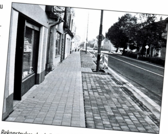
Rekonstrukce chodníku Holešovská si vyžádala náklad 1 mil. 600 tis. korun. Díky vytvoření zájezu pro zásobovací vozidla se touto investicí podařilo také zajistit i vyšší bezpečnost silniční dopravy na tomto úseku frekventované komunikace.

Stará škola už není tím, čím bývala. Školní družina se mohla díky nedostatku školáků přestěhovat do svých původních prostor, na její místo se stěhuje firma EMEA. CallCentrum, které pracuje pro desítky společností, převážně banky a telekomunikační firmy, zabírá celé první patro. Nájemník, který městu přináší nejen pracovní příležitosti, ale i ekonomický efekt.