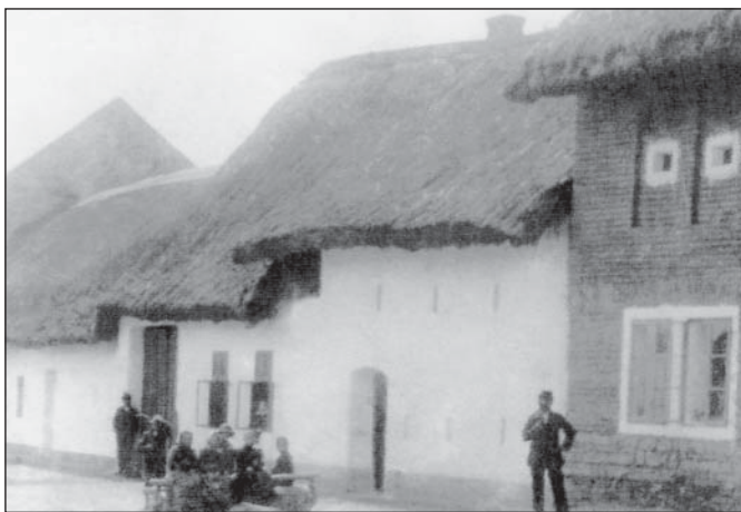
Rolnické stavení v Hejně, dnes Vrchlického ulici.