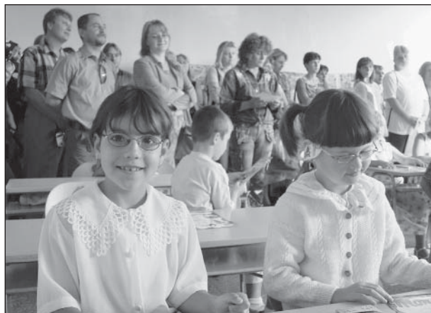
Největší radost měli z prvního školního dne ti nejmenší. Poprvé s nimi přišli do školy i rodiče.