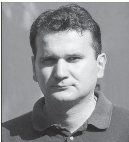
Nový hulínský duchovní.