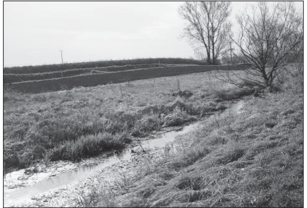
Potok v Záhlinicích se vylévá do polí a zneprůjemňuje obyvatelům život.