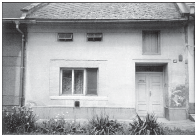
Uhodnete i tentokrát? Co zachycuje naše fotografie?