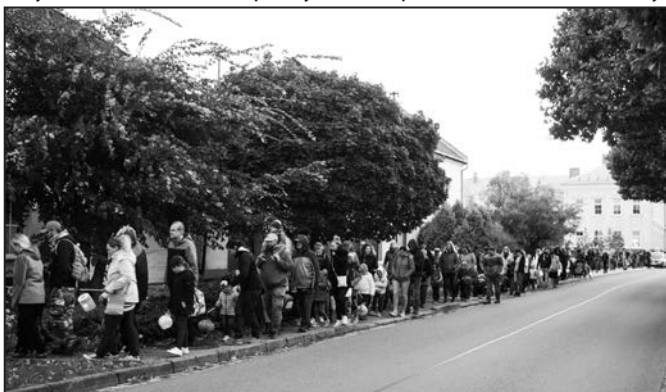
Světýlkový průvod měl obrovskou účast