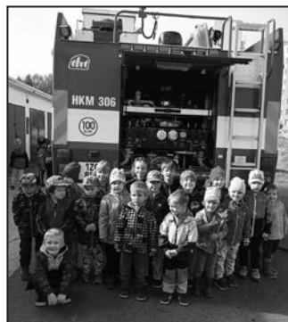
Hasiči dětem představili svou práci

Jedním z nich byl den, kdy jsme se setkali s hulínskými hasiči. Děti se dozvěděly, v jakých situacích hasiči zasahují, zopakovaly si číslo tísňové linky, zkoušely svou