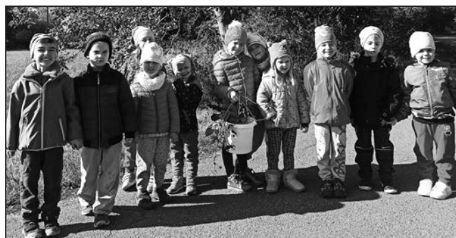
Eko vycházka byla spojená se sběrem kaštanů a šípků.