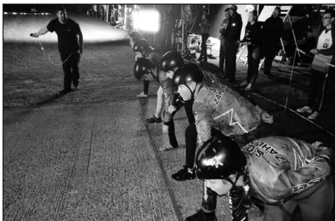
Noční hasičské závody už mají v Záhlinicích svou tradici.

Domácím týmům se na soutěži moc nedařilo. Starší žáci skončili na 23. místě s časem 36,81 a mladší na 7. místě s časem 26,14.