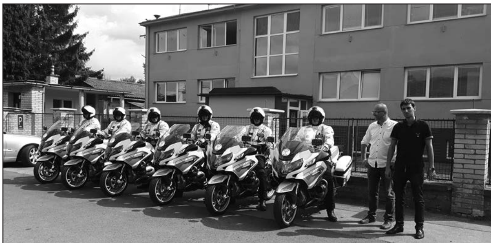
Vojenská policie před výrobním závodem PSÍ v Hulíně.

Zásadní roli v motoodevch hrají chrániče proti nárazu. Od prvopočátku naší výroby jsme vždy především kladli důraz na maximální bezpečnost našich oděvů. Naši poslední novinkou je systém zdvojené ochrany, který spočívá v sendvičovém uspořádání chráničů na exponovaných místech s názvem DEAS (double energy absorption system).