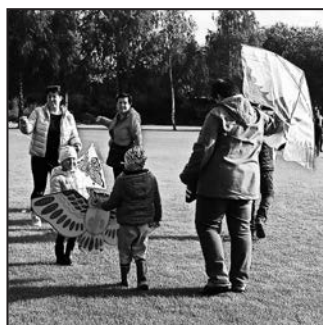
S Drakiádou pomohli také záhliničtí hasiči

Dny ve školce ubíhají jako voda a podzim nám s sebou přinesl spoustu nových zážitků. Ve spolupráci se záhlinickými hasiči se uskutečnila Drakiáda. Dopoledne si s námi počasí pohrávalo, ale odpoledne se obloha vyjasnila, mírně pofukoval větrík a draci i dráčky se vesele vznášeli ve výšce. Překvapila nás velká účast dětí a jejich rodičů i prarodičů. Hasiči připravili občerstvení (výborný čaj, párek v rohlíku, oplatek i drobné občerstvení pro dospělé), za což jim velmi děkujeme. Společně jsme si užili první podzimní den na čerstvém