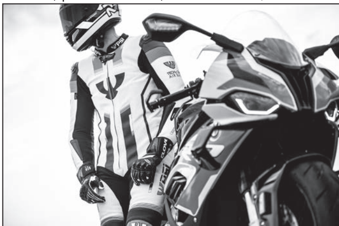
Novinka roku 2022, závodní kombinéza GAVELO s airbagem. 5x foto: PSÍ HUBÍK

Bezesporu nejzásadnější novinkou v posledních letech jsou airbagové systémy. Ty kompletujeme do svých výrobků od roku 2015, kdy jsme zahájili spolupráci s již zmiňovanou italskou firmou Dainese. Následně jsme se stali prvním servisním střediskem a prodejcem airbagů italské značky Alpinestars v Česku. V kolekci motooblečení chystáme plno novinek, na kterých usilovně pracujeme, jsou to nové bundy a kalhoty jak kožené, tak textilní, a oblíbené mezi motorkáři jsou i kevlarové motojeansy. Pevné místo v kolekci má i sekce VOLNÝ ČAS, kde nabízíme oblečení pro běžné nošení nebo i jiné sportovní aktivity než motorismus. Najdete tam trika, mikiny, kalhoty či kšiltovky pro příznivce naší značky.