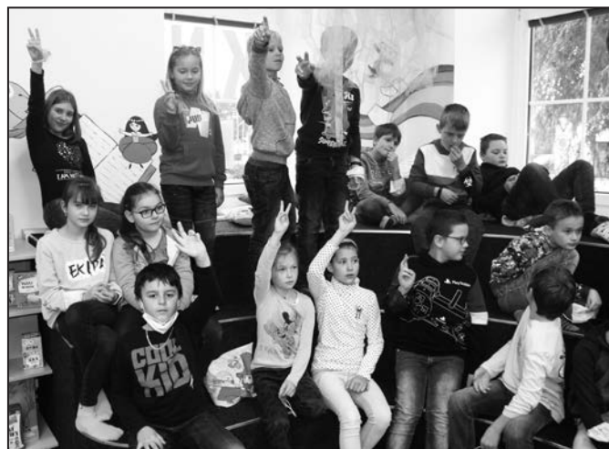
Děti doplňovaly chybějící slova.