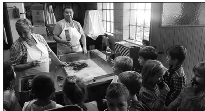
Výroba moštu je zajímavá a výsledek chutná všem.