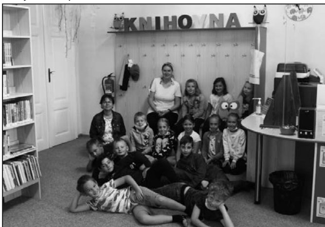
Když se zapojí pohádkové postavy, děti výuka baví.