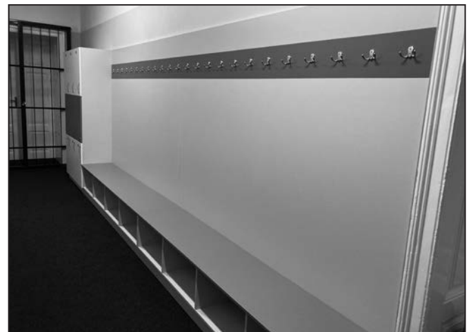
Nové skříňe přispívají ke zvýšení komfortu návštěvníků.