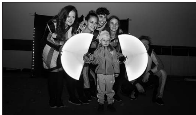
Akce nabídla zábavu pro celé rodiny.