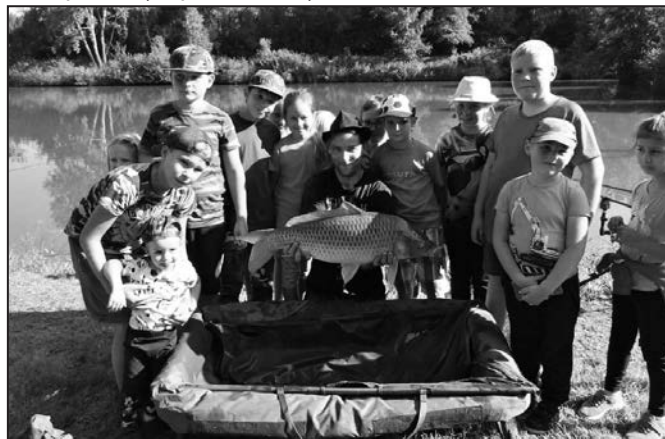
Chycené ryby čekala opět svoboda.