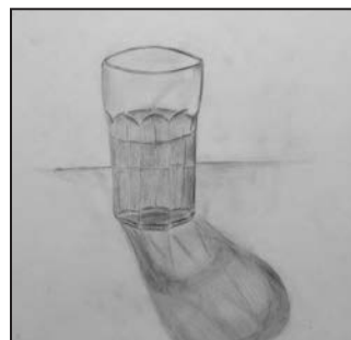
Oceněná práce Ondřeje Ludvíka.

V loňském školním roce 2020/2021 byl střediskem volného času Lužánky vyhlášen