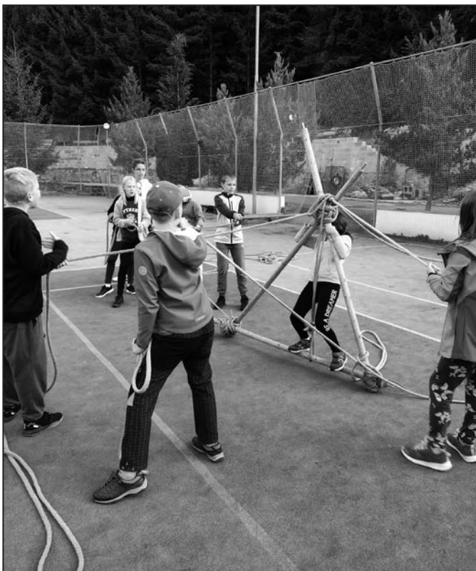
V programu toho bylo hodně a šlo také o důvěru.

V září vyjeli žáci šesté A hulínské základní školy za novými zážitky a hlubším poznáním spolužáků na třídní adaptační kurz na Rusavu. Program, o který se postarala organizace Tokaheya, se uskutečnil v prostorách penzionu U Ráztoky a v přilehlých lesích.