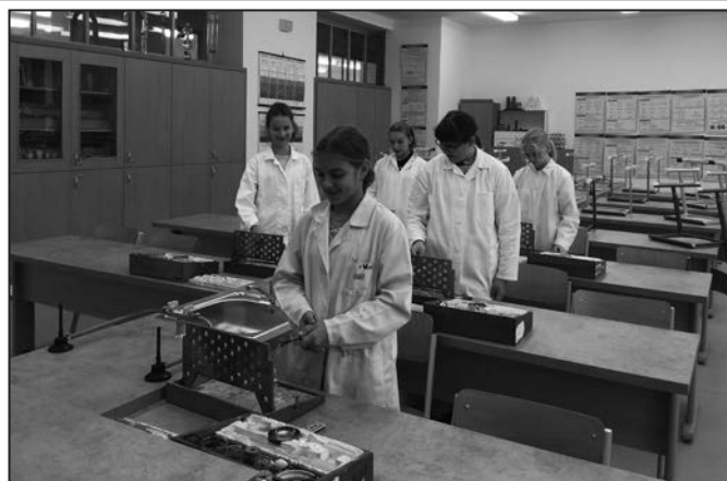
Pracovna chemie je moderně vybavená.