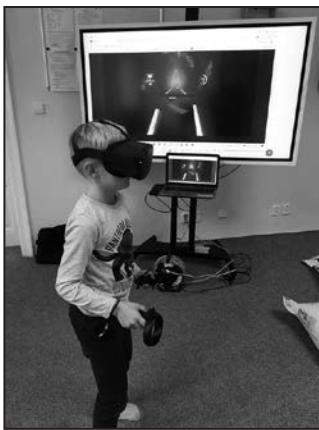
Interaktivní tabule má široké možnosti využití.

Aby mohla knihovna v Hulíně poskytovat kvalitní služby, musí mít k dispozici adekvátní podmínky pro svou práci. A to je úkol jejího zřizovatele, tedy města. To se snaží zázemí, vybavení i možnosti knihovny každoročně vylepšovat. Například v letošním roce se podařilo zrekonstruo-