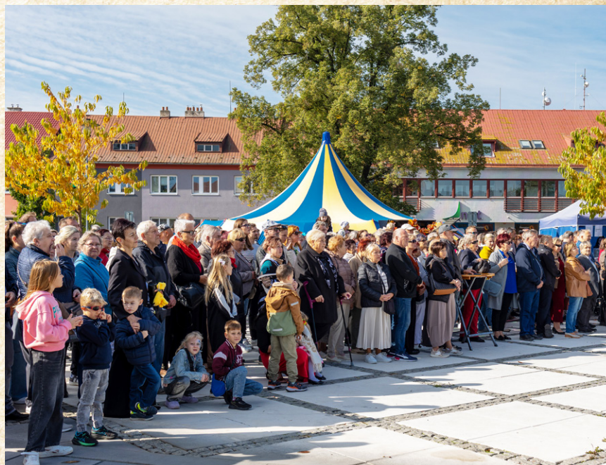
Přišli místní i přespolní. Ve velkém počtu