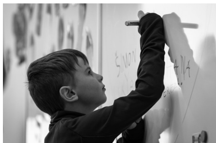
Ve škole si děti osvojí spoustu vědomostí a dovedností

Začátek září přinesl do naší školy velkou událost, do lavic poprvé usedli naši prvňáčci.