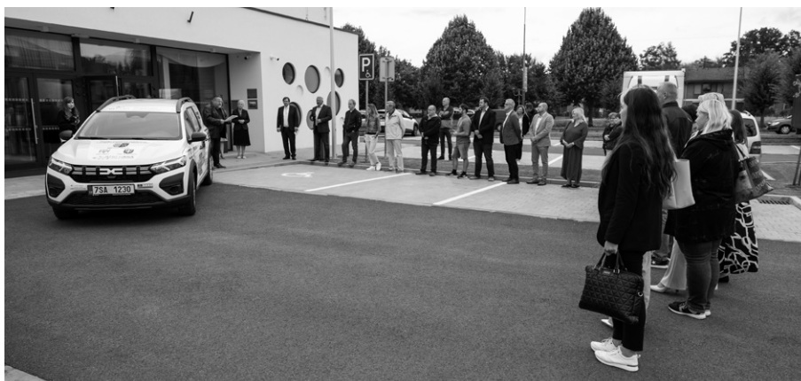
Předání automobilu DECENTu bylo slavnostní událostí