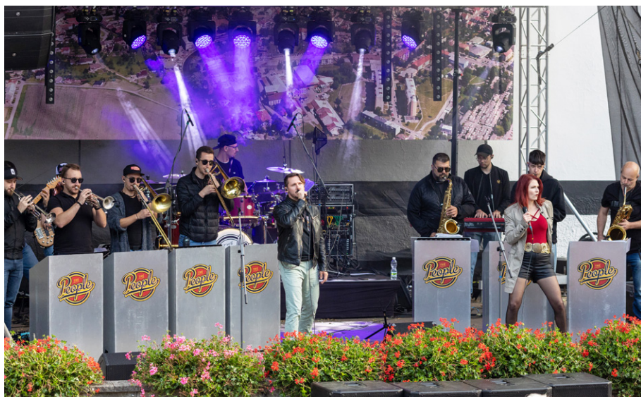
Hudby bylo na Svatováclavských hodech hodně.