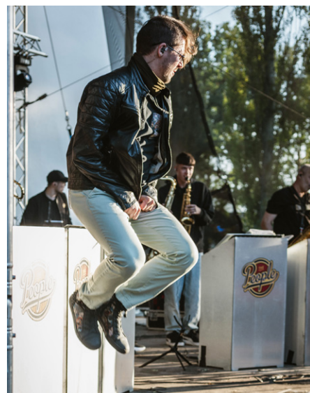
Koncerty si užili i vystupující