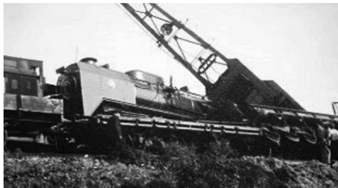
Němci vykolejili vlak pod kopcem Slivotín.

Čtrnáct lidských životů si vyžádalo vlakové neštěstí v Záhlinicích, od kterého nedávno uplynulo rovných osmdesát let. Přestože je prakticky zapomenuté, patří dodnes k nejtragičtějším železničním neštěstím na Moravě.