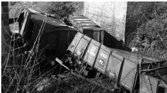
Následky nehody byly tragické