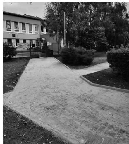
Chodník k budově Decentu je velmi frekventovaný.