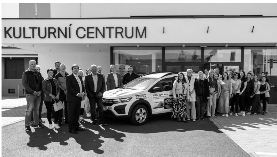
Program před Kulturním centrem byl zakončen fotografováním