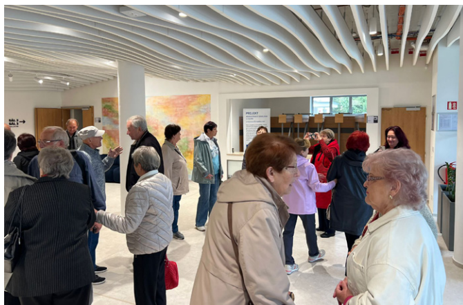
Prohlídka nově otevřeného Městského kulturního centra měla úspěch.