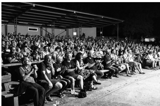
Areál si udržel své příznivce