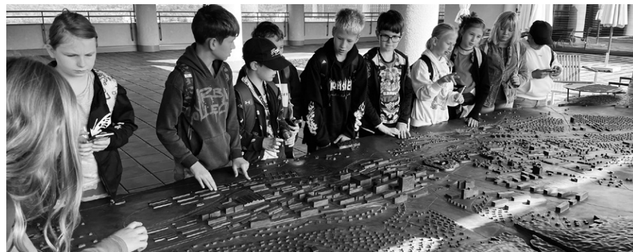
Na terase mrakodrapu si školáci prohlédli model Zlína.