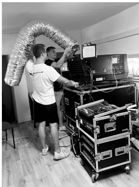
Instalace moderní promítací techniky a ozvučení od společnosti KINOSERVIS Zlín

V porovnání s předchozími roky byla o něco slabší. Hlavním důvodem je omezená nabídka filmů, což souvisí s horšími technickými možnostmi „letňáku“. Stávající promítací zařízení již neodpovídá