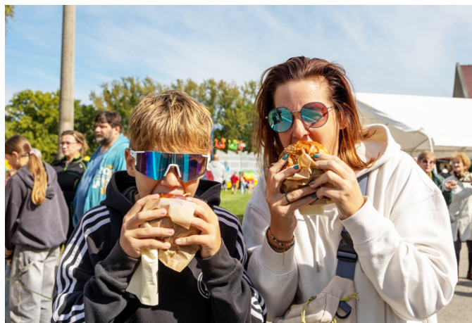
Na hodech chutnalo