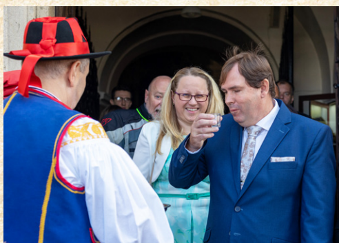
Na zdraví a úspěch Svatováclavských hodů!