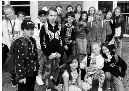
Sídlo Zlínského kraje děti z Hulína zaujalo

Na začátku 5. třídy probíráme ve vlastivědě učivo o Zlínském kraji. A nemohli jsme začít jinak, než že jsme vyrazili do Zlína navštívit sídlo kraje – Zlínský mrakodrap zvaný Jednadvacítka.