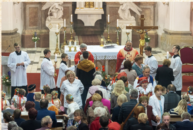
Hodová mše zaplnila kostel sv. Václava