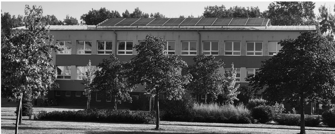
Opravu střechy se podařilo realizovat v termínu

Na letošní prázdniny byla naplánována oprava střechy pavilonu družiny a jídelny základní školy. Díky důslednému stavebnímu dozoru a práci investičního odboru se celá akce podařila v termínu a žáci mohli první školní den přijít do školy bez případného rizika. Oprava byla zaměřena na ukotvení a obnovu konstrukce střechy, výměnu tepelné izolace, výměnu střešní krytiny a odvodu dešťových vod. Celá akce se plánovala i s ohledem na projekt vybudování fotovoltaické elektrárny na této střeše.