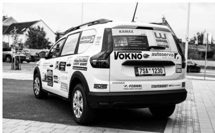
Každý dárce má na karoserii svou reklamu