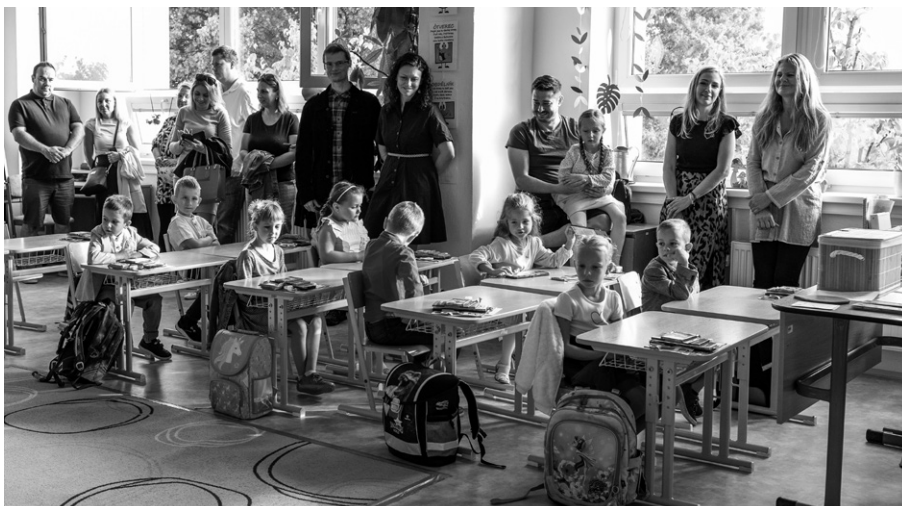
Slavnostní okamžik si prvňáčci prožili se svými rodiči.