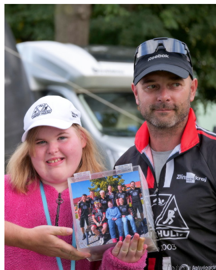
Foto na titulní straně: Základní škola přivítala prvňáčky. Autor: ZŠ Hulín. Autoři fotografií na str. 2 jsou uvedeni u jednotlivých článků