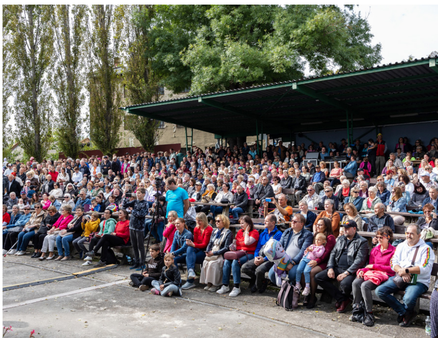
Hlediště letního kina bylo zcela zaplněné.