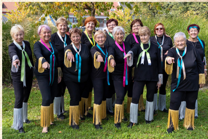
Spolek zdravotně postižených Hulín a jejich vystoupení Dancing Queen – tančící královny

Velký zájem veřejnosti, a tedy i parádní atmosféra. Bohatý program pro malé i velké návštěvníky. Tradice, folklór, sport, zábava, hudba... Letošní svatováclavské hody se vydařily. Ke spokojenosti návštěvníků, vystupujících i organizátorů.