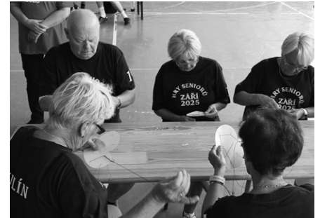
Soutěžní úkoly byly o sportu i důvtipu