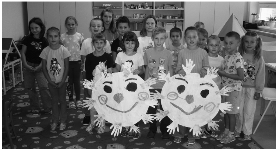
V každé pohádce dobro vítězí nad zlem.

Za kolektiv vychovatelek ŠD Hulín Eva Formánková