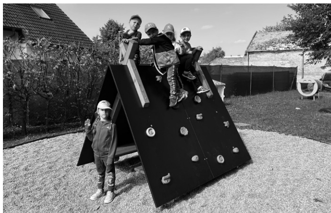
Dokud to jde, tráví děti co nejvíce času na čerstvém vzduchu na zahradě školky.

K novým prvkům na zahradě z loňského školního roku přibylo během prázdnin ještě překvapení v podobě parádní prolézačky ve tvaru tee-pee, kterou si děti v průběhu září ihned oblíbily.