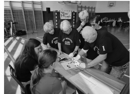
Důležitá byla spolupráce členů družstva.