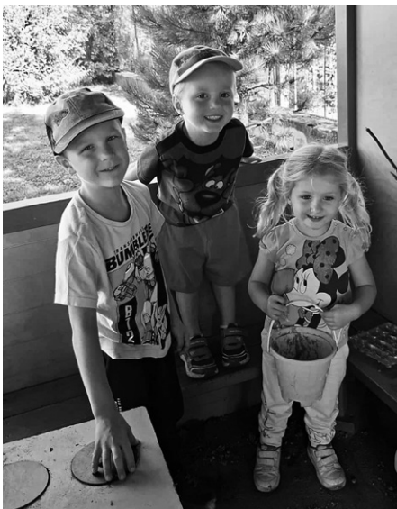
Dětem se dostává ve školce maximální péče a pozornosti.

Naše mateřinka přivítala na začátku měsíce září malé kamarády. Byly mezi nimi děti zcela nové, které si na školku teprve zvykaly, také „střenačci“, co už rok do školky chodily, znají ji a mají ji rády, a v neposlední řadě skupina dětí pěti- a šesti letých, našich mazáků, předškoláků. Předškoláci, na těchto dětech nejlépe vidíme, jak čas letí. Ještě před chvílí se držely máminých sukniček a nyní se chystají do základní školy. Zahájení školní docházky je velmi důležitým krokem, který vzbuzuje množství obav a otázek nejen v hlavičkách budoucích prvňáčků, ale zejména jejich rodičů. Je moje dítě dostatečně zralé a připravené? Je dost