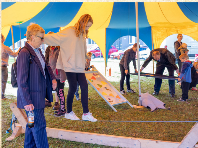
Výuka cirkusových dovedností lákala