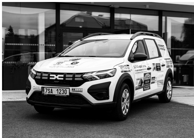
Nový automobil byl hned nasazen do provozu.

Síly spojilo 36 firem, město Hulín, obce Břest a Kyselovice a MAS Jižní Haná. A záměr se podařil: organizace DECENT Hulín poskytující sociální služby má k dispozici nový automobil. K jeho slavnostnímu předání došlo v úterý 16. září v Hulíně.