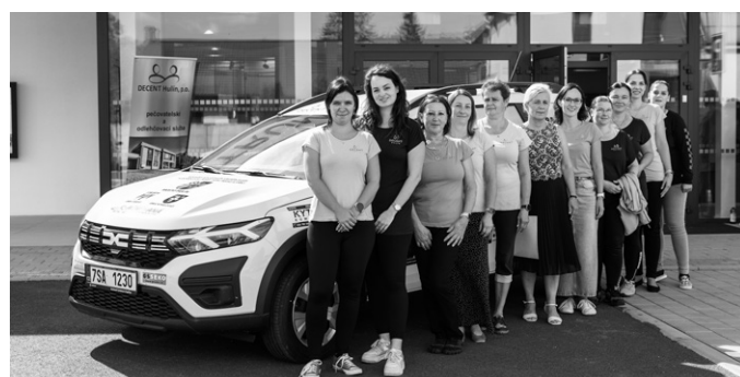
S vozem budou jezdit pracovnice DECENTu. 9x foto: J. Zapletal