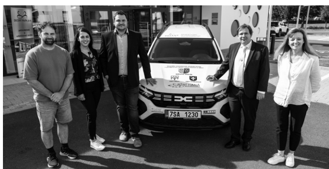
Mezi podporovateli projektu byla i MAS Jižní Haná, jejímž je město Hulín členem