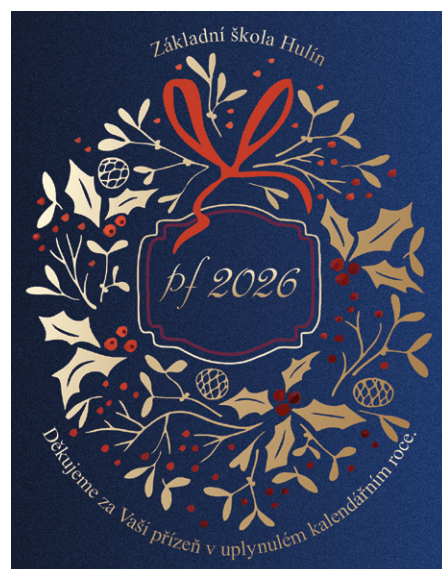
Foto na titulní straně: Rozloučili jsme se s rokem 2025 a přivítali rok 2026. Vedení města Hulína, Městský úřad Hulín a zpravodaj Hulíňan přejí všem čtenářům, aby byl co nejuspěšnější. A hlavně pevné zdraví! Autor: L. Polišenská. Autoři fotografií na str. 2 jsou uvedeni u jednotlivých článků