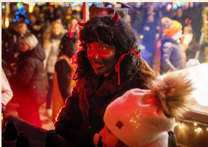
Čerti patří k českým pohádkám i do vánočního Hulína