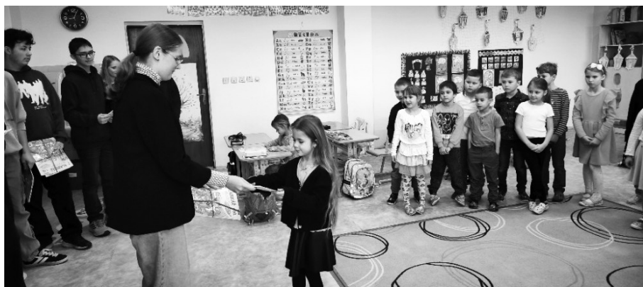
Setkání bylo slavnostní pro obě třídy.