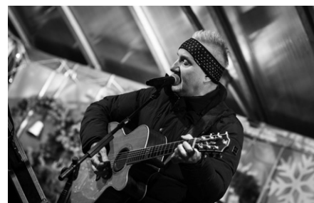
Česko zpívá koledy má už v Hulíně tradici.

Děkujeme všem, kdo dorazili, zpívali, tleskali, usmívali se a vytvořili tak krásnou předvánoční atmosféru.