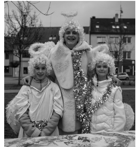
Atmosféru dotvářely kouzelné postavičky