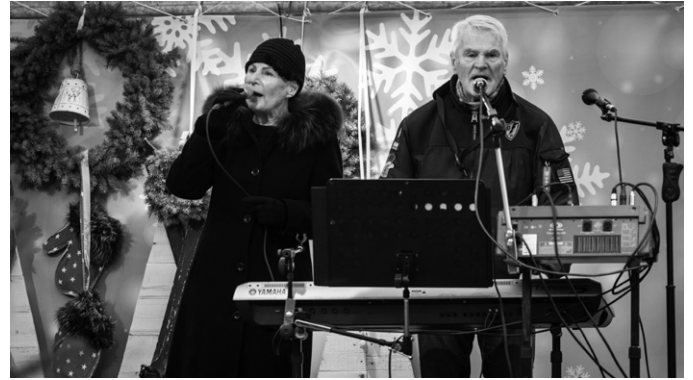
Náměstí Míru bylo rozezpíváno

Adventní období v Hulíně bylo i v minulém roce naplněné kouzelnou atmosférou a krásným kulturním programem na náměstí Míru. První adventní neděli jsme společně slavnostně rozsvítily vánoční strom, čímž jsme symbolicky odstartovali sváteční čas. Druhou neděli nám žáci ZUŠ Hulín připravili jedinečné Andělské putování, které potěšilo malé i velké návštěvníky.