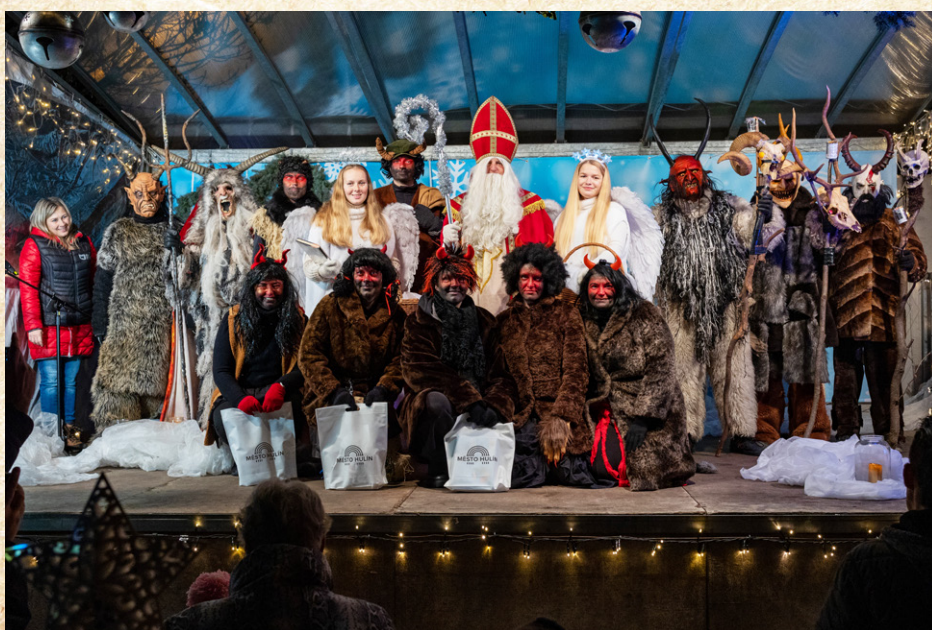
Mikulášská akce byla perfektně připravená.