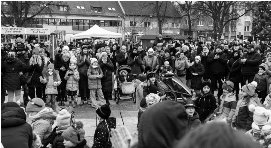
Hulín si umí adventní období užít.