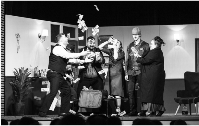
V kufříku jsou statisíce liber!

To je název inscenace anglického dramatika, kterou ve výborném překladu předvedlo Divadlo Hulín v režii Patrika Možíše v sále MKC Hulín.