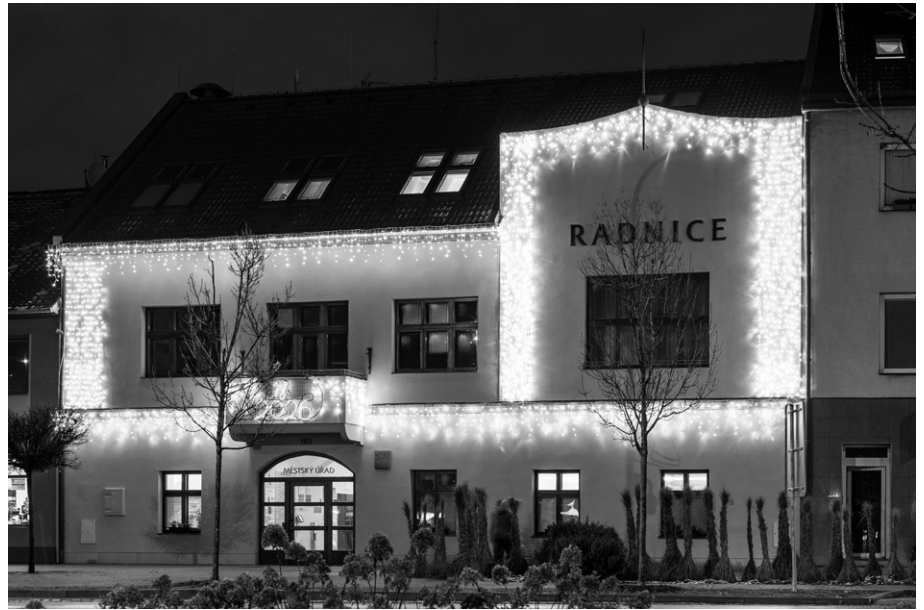
Vedení radnice děkuje za podporu v roce 2025 a přeje všem úspěšný a spokojený rok 2026.

Pro podporu sportu je v plánu dobudování sociálního zázemí pro volejbalové a tenisové kurty v parku. Po mnoha letech čekání na dotace jsme se rozhodli zbudovat zázemí z kontejnerové sestavy,