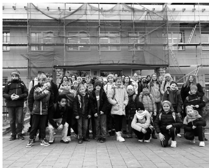
Žáci z Hulína nabrali velkou inspiraci.