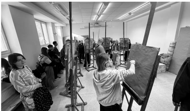
Návštěvníci viděli, jak vznikají originální designy a kresby