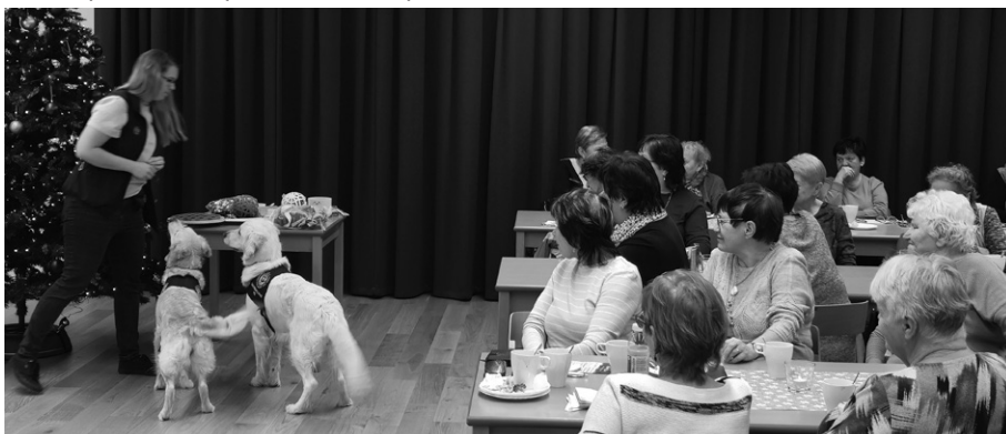
Studenti akademie si vyslechli přednášku o canisterapii.