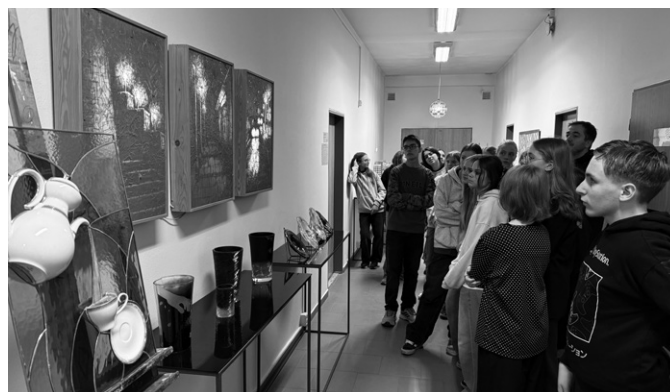
Tavení a tvarování skla jsou fascinující procesy. 2x foto: ZŠ Hulín