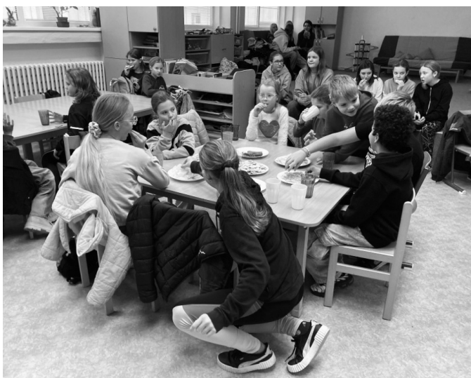
Aktivita bylo ve Štípě opravdu hodně