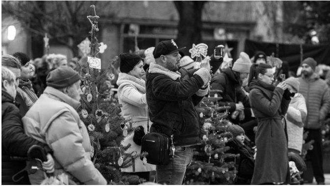
Občané Hulína i hosté se účastnili programů ve velkém počtu