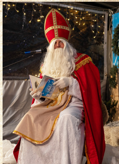
Mikuláš byl důstojný a dobrosrdečný

Děkujeme SDH Hulín za spolupráci a hlavně všem dětem a rodičům, kteří přišli vytvořit tu pravou mikulášskou náladu!