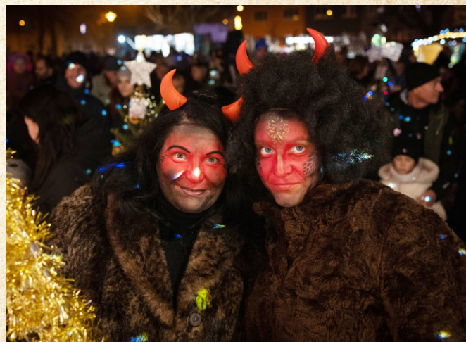
Pohádkové bytosti pomohly vytvořit kouzelnou atmosféru