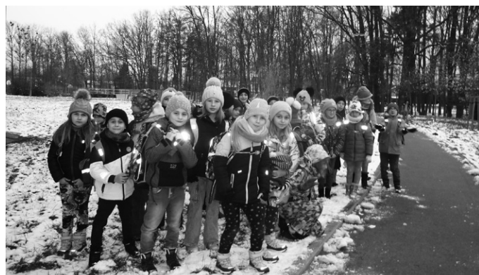
Tak ať je ten rok 2026 co nejlepší!

Sváteční dny, vůně cukroví či jehličí, Silvestr a vítání nového roku se staly minulostí. Do současnosti se s hrdostí postavil rok 2026.