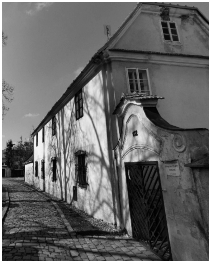
Budova farnosti Hulín zvaná „Kaplanka“.