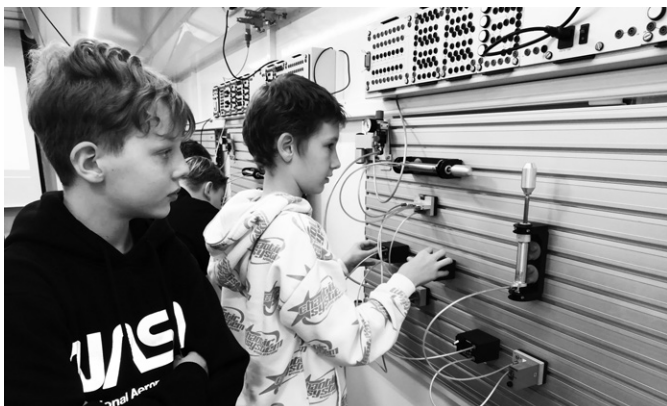
Žáci si vyzkoušeli elektroniku, elektrotechniku, hydrauliku, pneumatiku i robotiku. ZŠ Hulín