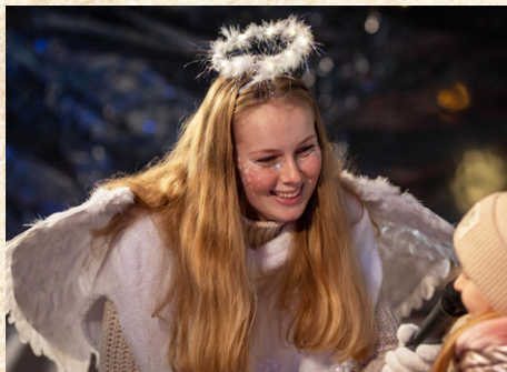
Andílkům se v Hulíně líbí. A Hulínu se líbí andílci

Hulín a hlavně náměstí Míru zažily neopakovatelnou atmosféru! Ulicemi se pohybovali čerti – někteří sympatičtí, jiní pořádně děsiví – ale naštěstí je doprovázeli dobrosrdečný Mikuláš s andílkou.