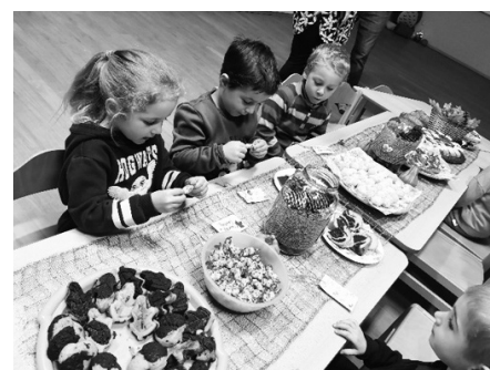
Děti tvořily i pracovaly. A vše jim šlo.