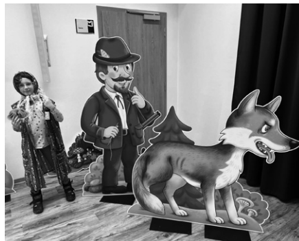
Možnost vyfotit se s pohádkovými postavami byla lákavá.

Návštěvníci si mohli prohlédnout velkoformátové ilustrace známých pohádek jako Červená karkulka, Sněhurka a sedm trpaslíků, O Smolíčkovi, Perníková chaloupka, Popelka a další.