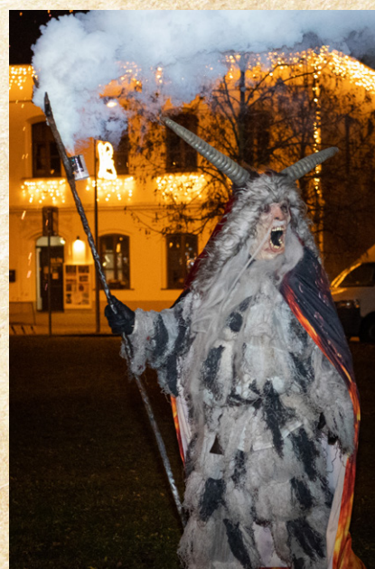
Tak na viděnou v roce 2026!