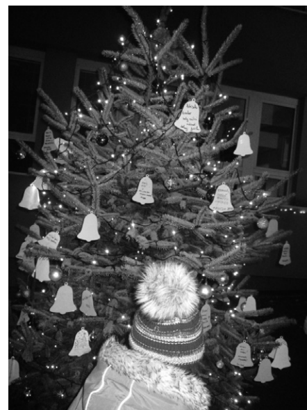
Pod vánočními stromy našly děti mnoho splněných přání.

být hmotná věc, že to, co je nejdůležitější, si za peníze nemůžeme koupit. Mnohem cennější je zdraví, kamarádství... Mnohdy zdánlivě obyčejné věci, jako třeba úsměv, pohlázení, vlídné slovo mohou dělat zázraky.