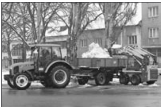
Odklizení sněhu na hulínském náměstí.