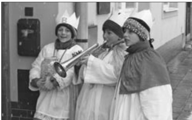
Tříkrálovi koledníci v jedné z hulínských ulic.