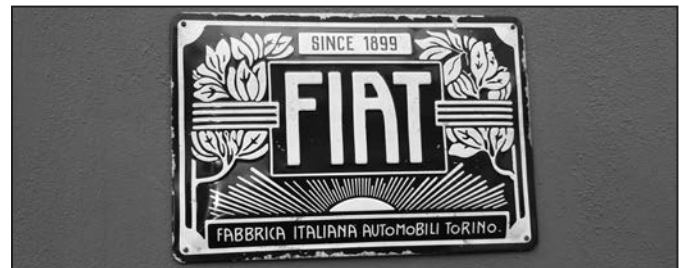
První logo automobilky Fiat