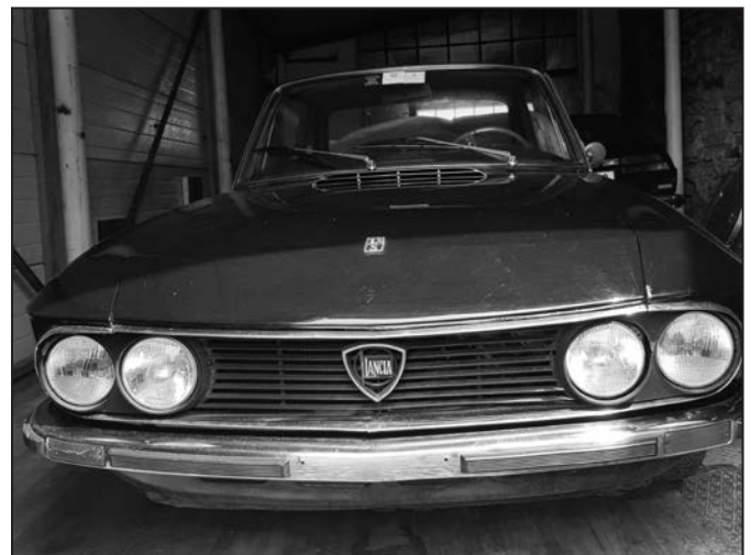
Překrásná Lancia Fulvia Coupe, součást sbírky hulínského patriota