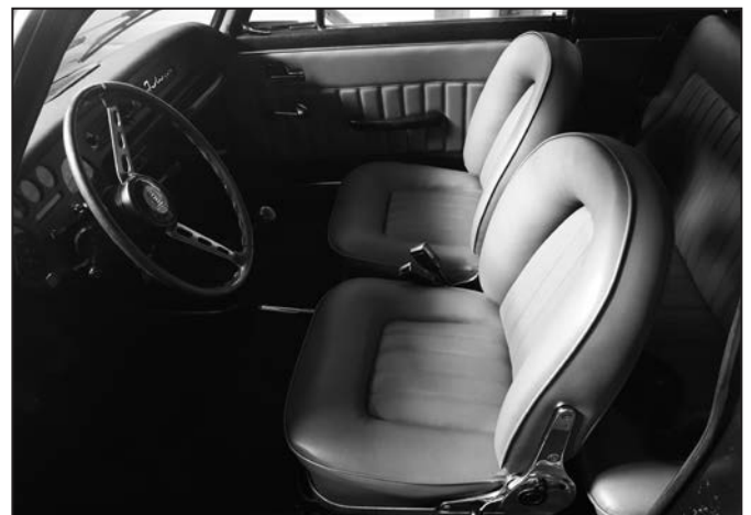
Také interiér vozu Lancia Fulvia Coupe je skvostný. 12x foto: Z. Dvořák