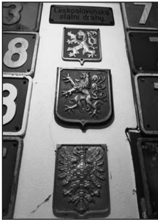
Státní symboly na lokomotivách (shora): prvorepublikový, protektorátní český a moravský