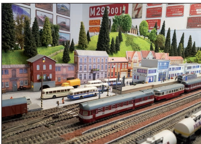
Model železnice je vyveden do nejmenších detailů