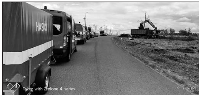
Hasičské sbory patřily mezi organizace, které nabídly účinnou pomoc. SDH Hulín nechyběl.

Ještě před odjezdem hulínští „dobráci“ uspořádali materiální sbírkou. Díky veřejnosti i několika firmám se podařilo shromáždit spoustu pracovního nářadí, oblečení a ochranných pomůcek, jako lopaty, kolečka, trička či rukavice, dále drogerii, zdravotnický materiál či třeba lepidla. „Vezli jsme toho plný vozík, vše jsme odevzdali na