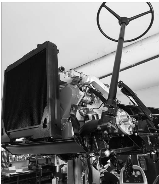
Renovace podvozku a hnací soustavy vozu Alfa Romeo A12 Kamiončino