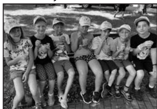
O účastníky bylo parádně postaráno.

Jako obvykle si děti mohly v úvodu tábora libovolně namalovat kšiltovky nebo batikovat trička v barvách tábora. Děti mohly také absolvovat jízdu zručnosti na