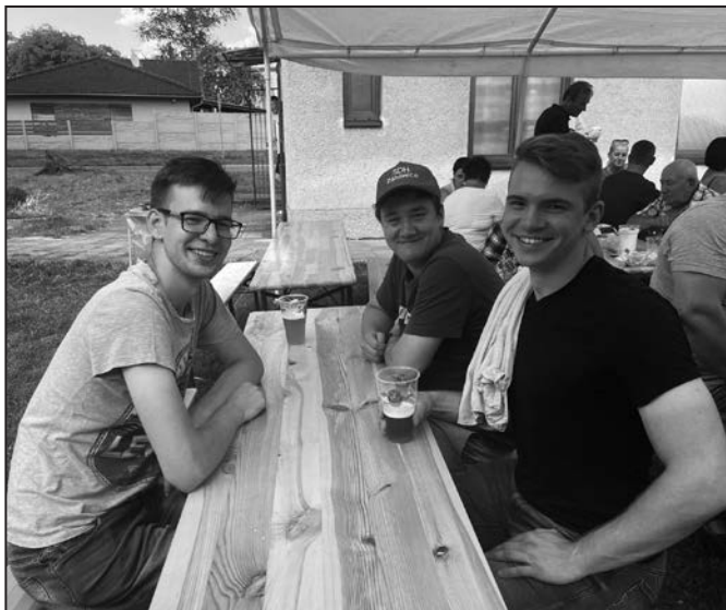
K hodům neodmyslitelně patří pohoda a občerstvení.