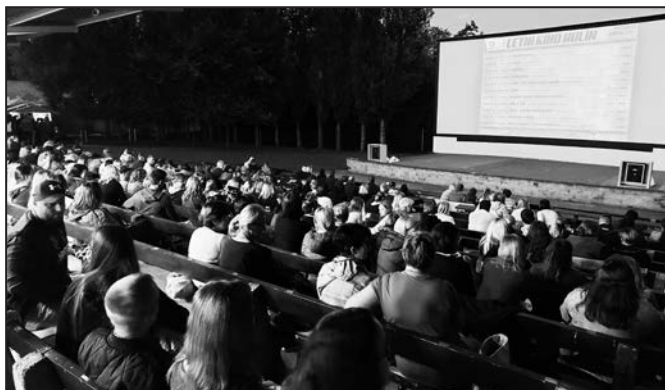
Hlediště letního kina se často naplnilo diváky.