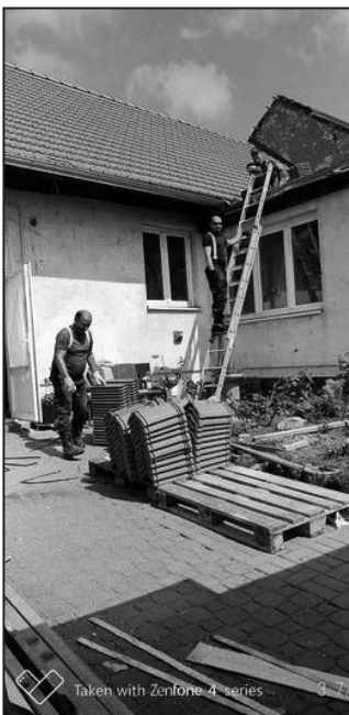
Hasiči se uplatnili zejména při výškových pracích.

Havlíčková 3057, Kroměříž | ☎ 573 334 095 | www.kamax-metal.cz