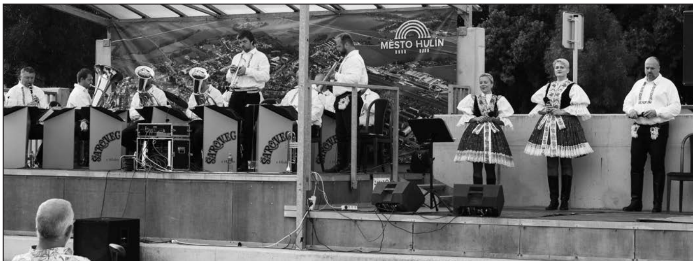
Koncerty se konaly tradičně ve čtvrtek.