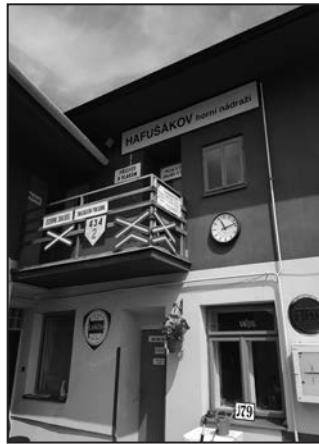
Horní nádraží je vlastně jedinečným muzeem