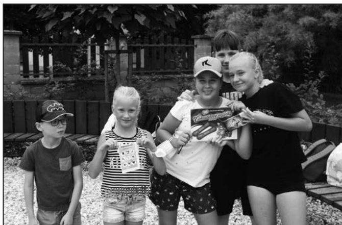
Knihy, soutěže, poznávání a také odměny.

z Kroměříže ze ZŠ Slovan. Jelikož u nás děti byly poprvé, ukázali jsme si knihovnu i zahradu, na které bylo připraveno zahradní bingo, představili jsme si knižní sérii „Přežil jsem“ a plnili jsme několik zábavných úkolů. Ve čtvrtek 22. července za námi přišly děti z příměstského tábora Orel jednoty Hulín. Abychom dětem ukázali, že knihovna není jen o půjčo-