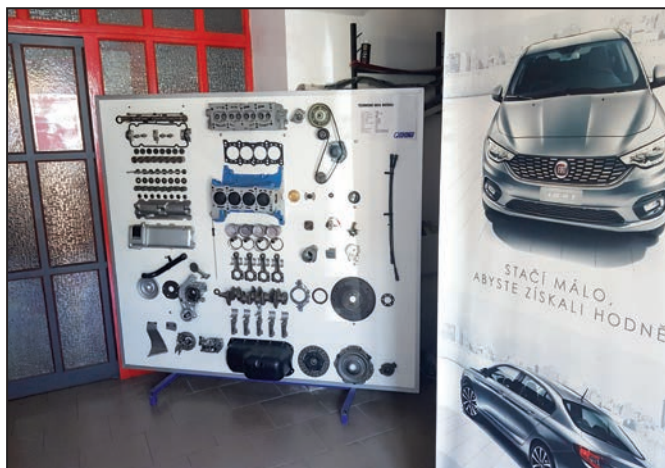
Rozložený motor, pro mnohé návštěvníky autoservisu nová podívaná