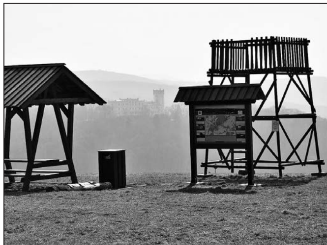
Vyhlídka Vranovy Žleby

V Bojkovicích rozhodně nevynechejte návštěvu Muzea Bojkovska . Nabízí zajímavé expozice z dávné i docela nedávné historie města a života v něm, včetně zdejších řemesel a cechů. Zcela unikátní je expozice věnovaná dnes již zaniklému řemeslu zvěrokleštičskému, pozoruhodná