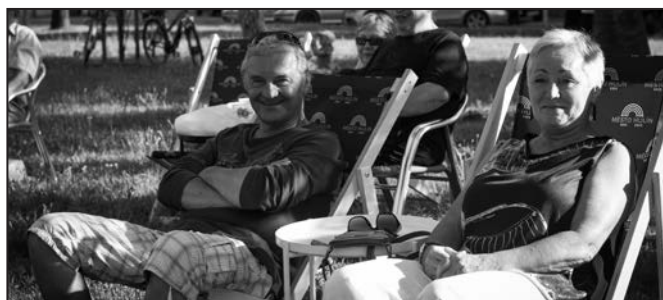
Pohodové koncerty byly opravdu pohodové.