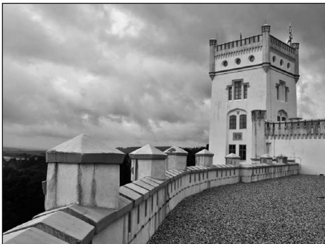
Zámek Nový Světlov