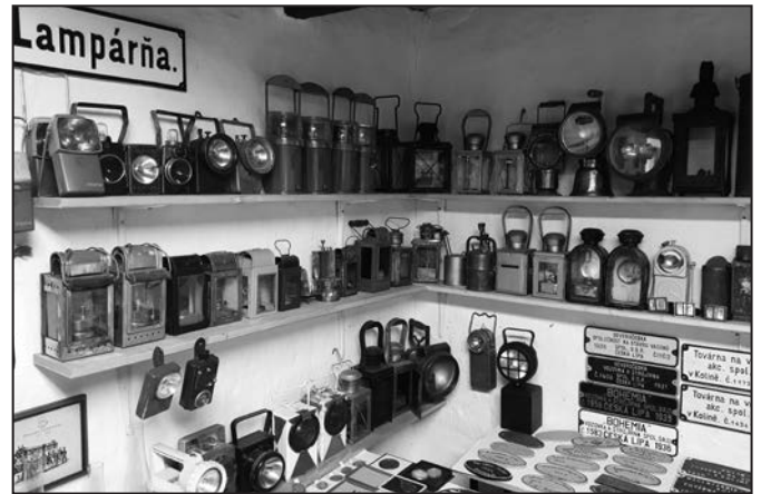
Sbírka lamp používaných na dráze