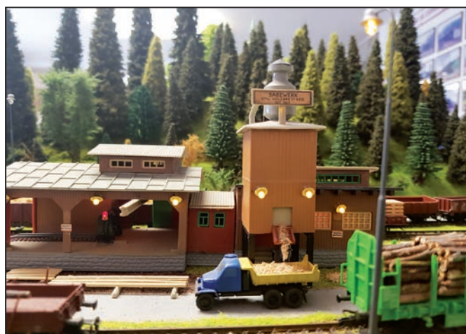
Nechybí ani pila

Měsíčník Hulíňan vydává město Hulín, IČ: 00287229, Hulín, nám. Míru 162.