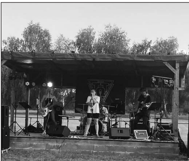
Rocková kapela TTQ rozhodně zaujala.