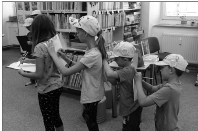
Knihovna v Hulíně byla o prázdninách plná dětí.

vání knih, připravili jsme si pro ně zábavné odpoledne plné společenských her. Děti sčítaly čísla, aby mohly ulovit rybičky, hledaly ztracené ponožky krokodýla Dundeeho, odpovídaly na otázky z mořského světa a společně s Mlsandou a Zdravoušem se učily zásadám zdravého životního stylu.