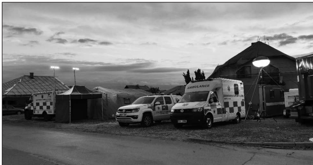
Záchranáři zareagovali na výzvu o pomoc z Jihomoravského kraje.

Okamžitý zásah hned po katastrofě i následné zajišťování potřebné zdravotní péče. Záchranáři Zdravotnické záchranné služby Zlínského kraje (ZZS ZK) se naplno zapojili do pomoci obcím na jižní Moravě, které zdevastovalo ničivé tornádo.