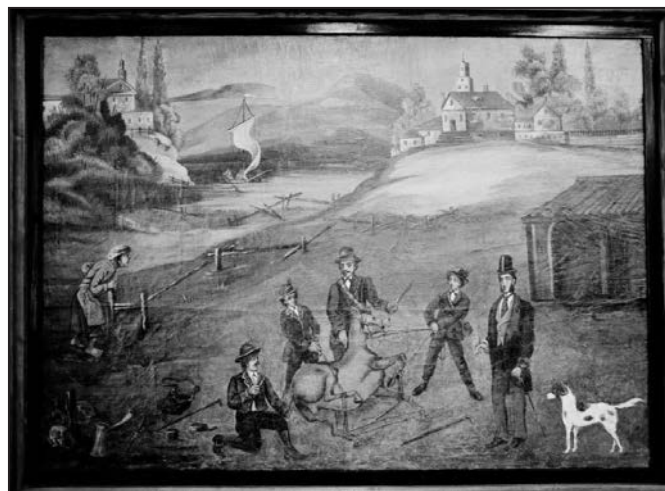
V muzeu je k vidění i expozice věnovaná již zaniklému zvěrokleštičskému řemeslu.