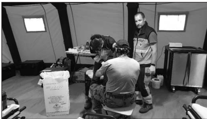
Každý den ošetřili kolem 40 lidí.