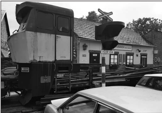
Na dolním nádraží stojí lokomotiva