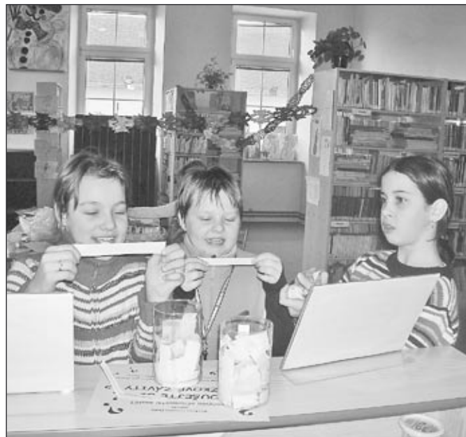
Trochu potrápít mozkové závity museli účastníci vědomostní soutěže v hulínské knihovně.