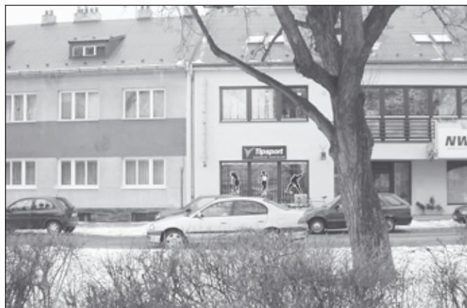
Ačkoliv je sázková kancelář Tipsport přímo na náměstí, už vícekrát ji přepadli ozbrojení lupiči.

Lupič měl podle popisu na očích dioptrické brýle, oblečen byl do světle modrých riflových kalhot, bundy stejné barvy sahající do pasu, černých rukavic a modrého kulicha. Na nohou měl kožené boty. Policisté, kteří po pachateli pátrají, prosí o spolupráci veřejnost. Lidé, kteří se ve výše uvedený den a dobu pohybovali na hulínském náměstí Míru, a mohli by k přepadení poskytnout nějaké informace, ať se ozvou na telefonní číslo 158 nebo na kteroukoliv policejní služebnu.