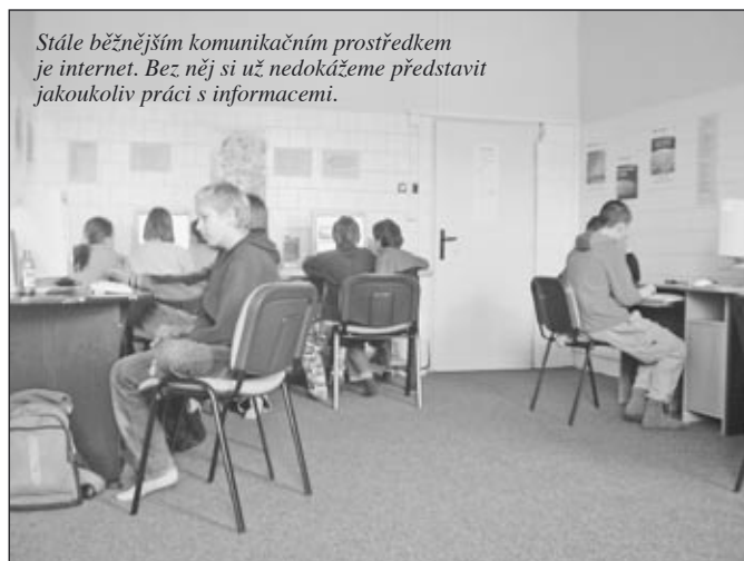
Stále běžnějším komunikačním prostředkem je internet. Bez něj si už nedokážeme představit jakoukoliv práci s informacemi.

Nový prostor dostanou na stránkách města i hulínské podnikatelské subjekty, které si sem budou moci umístit odkaz na internetové stránky své firmy.