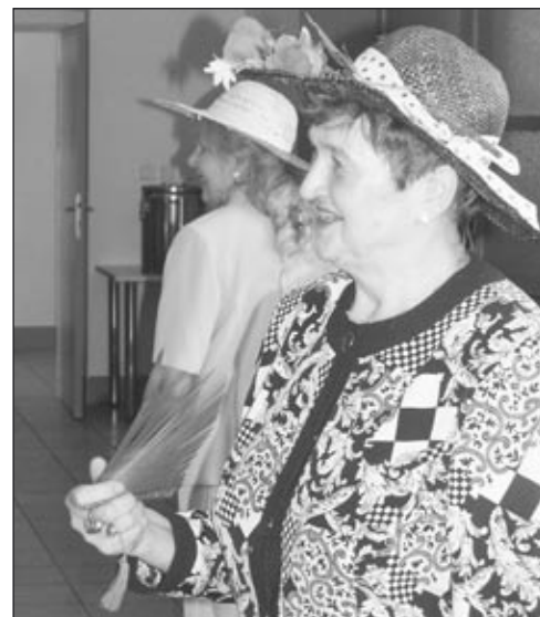
Dámy z hulínského Klubu žen dokázaly, že žena může být krásná a elegantně oblečená v každém věku. V Domově důchodců ve Vážanech předvedly zdejšmu osazenstvu módní přehlídku (viz str. 5).