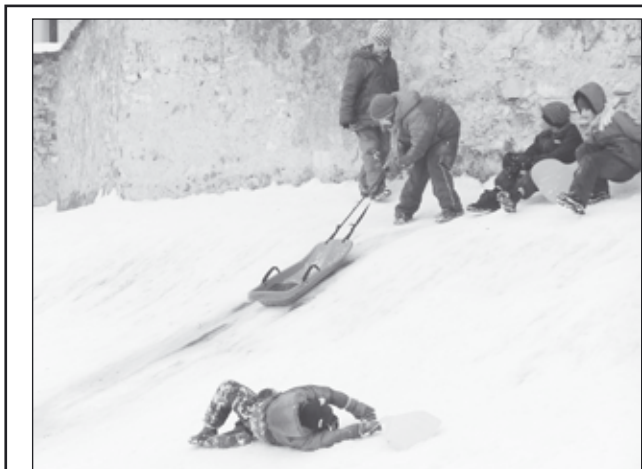
Už desítky let nebyla v Hulíně a konec konců na celé Moravě zima tak neskutečně dlouhá a vytrvalá. Téměř tři měsíce bez přerušení vydržela sněhová pokrývka a často i silné mrazy.

Díky oběma prodejům získá město poměrně slušnou finanční částku do městského rozpočtu.