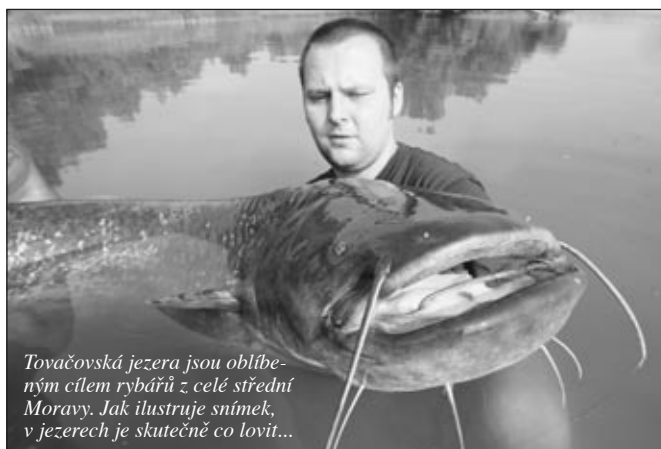
Tovačovská jezera jsou oblíbeným cílem rybářů z celé střední Moravy. Jak ilustruje snímek, v jezerech je skutečně co lovit...