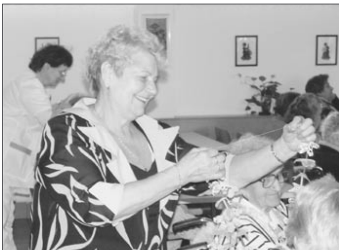
Během módní přehlídky hulínské ženy ozdobily své publikum takřka havajskými ozdobami.

Kroměříž, Hulín (mi) – Žena může být krásná v každém věku, proč by to tedy neplatilo i o seniorkách? V pondělí 6. března si toto pravidlo ověřili na vlastní oči obyvatelé domova důchodců ve Vážanech. Tím, kdo je o tom přesvědčil, byly členky Klubu žen z Hulína. Pro důchodkyně si hulínské dámy připravil zábavné dopoledne, které se neslo ve znamení středěční oslavy Mezinárodního dne žen. Vrcholem programu byla módní přehlídka.