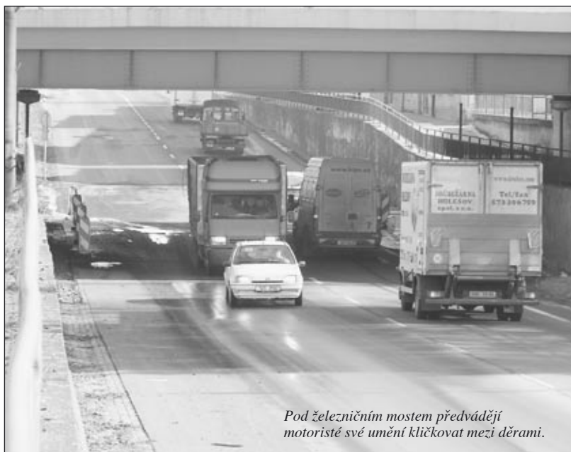
Pod železničním mostem předvádějí motoristé své umění kličkovat mezi děrami.

Hulín (mi) – Motoristé to v Hulíně neměli a nemají jednoduché; i když by letos měla být kompletně opravena cesta do Holešova, přesto řidičům zůstane přinejmenším jeden problém. Tímto nepříjemným momentem je podjezd pod železničním mostem. Vozovka v těchto místech vypadá spíše jako střelnice pro armádní kanóny. Otázkou je, zda, kdy a kdo dokáže tuto silnici opravit. Běžné silničářské výprávký totiž na tomto místě nic neřeší.