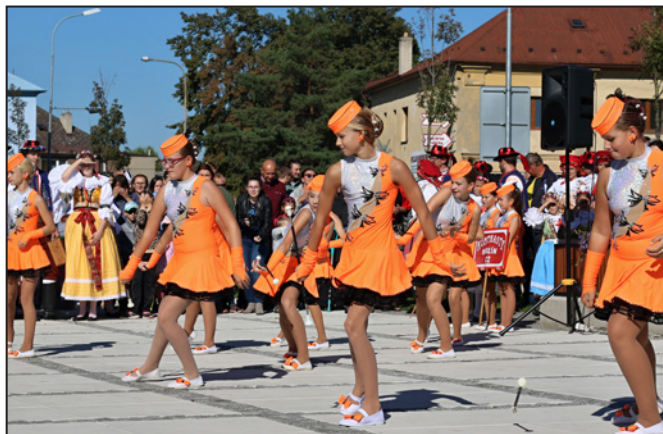
Vystoupení Mažoretek Kontrasty Hulín