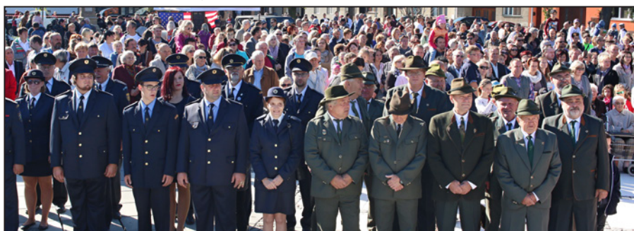
SDH Hulín, SDH Záhlnice a Myslivecké sdružení Rovina Hulín při slavnostním nástupu