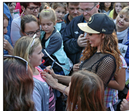
Děkujeme za návštěvu na Svatováclavských hodech 2018 v Hulíně. Pracovníci MKC Hulín