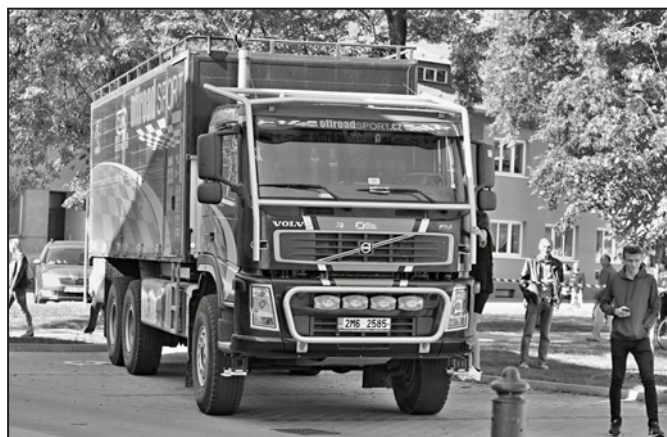
Milovníci Dakar rallye si prohlédli dva dakarské speciály týmu OFFROADSPORT.CZ