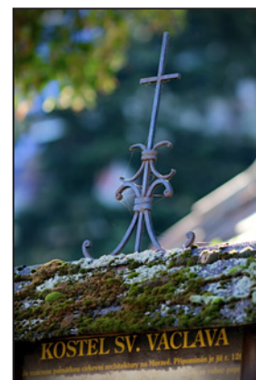
Sváteční mše v kostele Sv. Václava v Hulíně