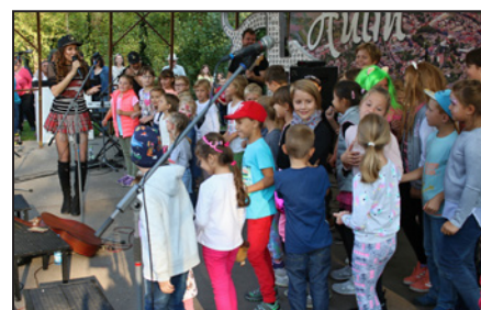
Olga Lounová rozproudila svoji show mladší i starší ročníky. Nekonečná fronta na podpisy a CD svědčila o tom, že Olga právem patří mezi pěvecké hvězdy.