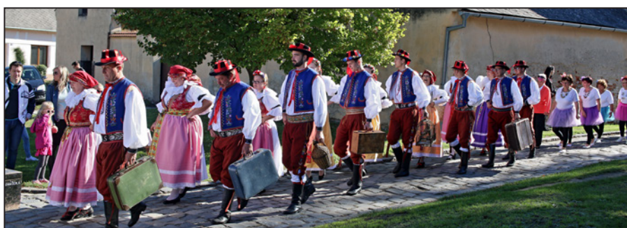
Slavnostní průvod od kostela sv. Václava na náměstí Míru