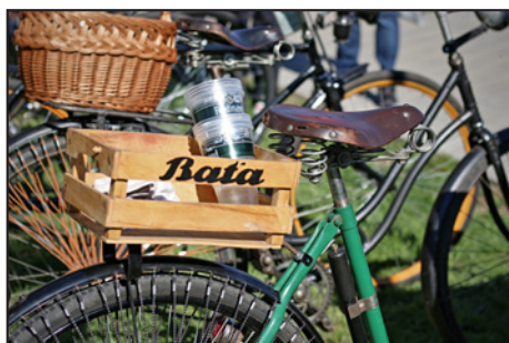
Přehlídka motocyklů značky Harley Davidson z Muzea Harley Pub Otrokovice