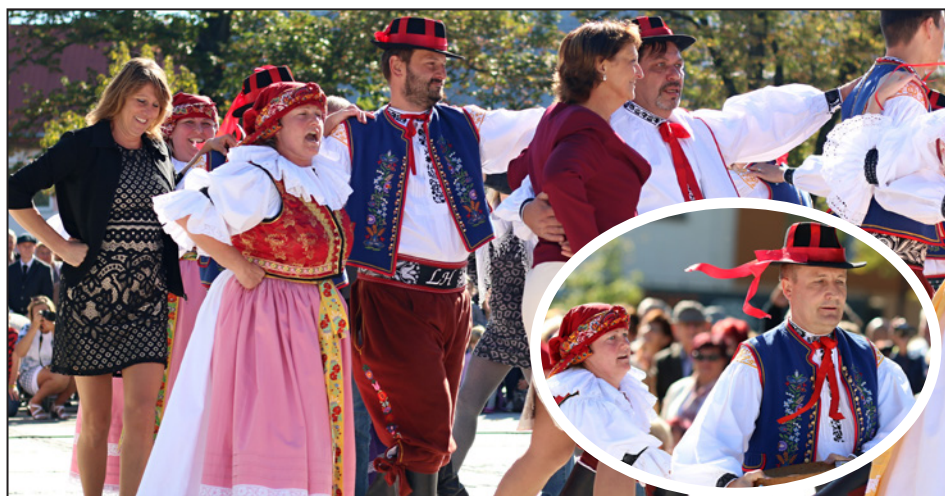
Vystoupení Hanáků z Hulína