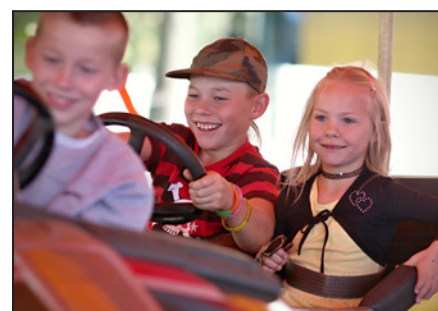
Především děti si užívaly na kolotočích