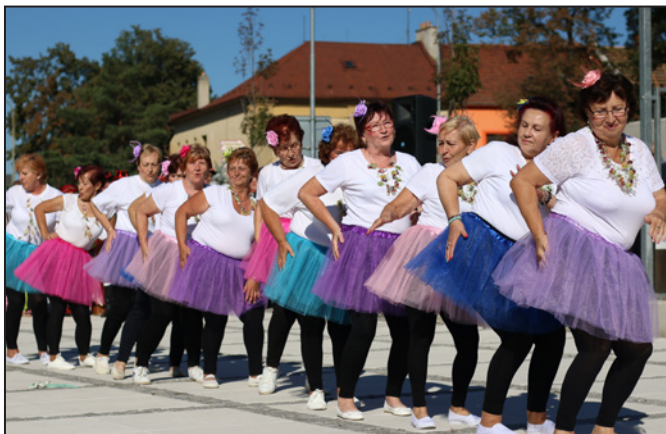
Taneční vystoupení senierek ze Spolku zdravotně postižených Hulín