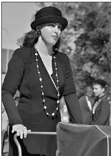
Módní přehlídka Muzea Nejen hraček Hulín