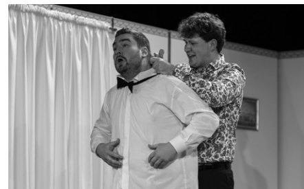
Svatba může být i dramatická záležitost