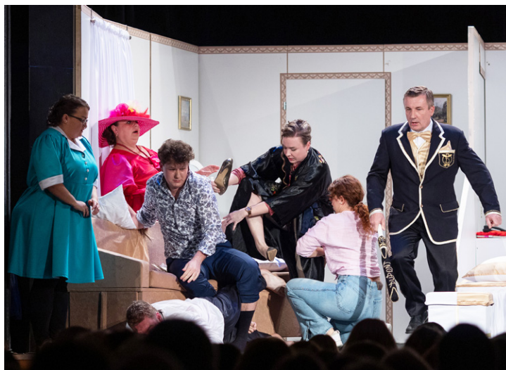
Hra měla opravdu spád, bavila účinkující i diváky