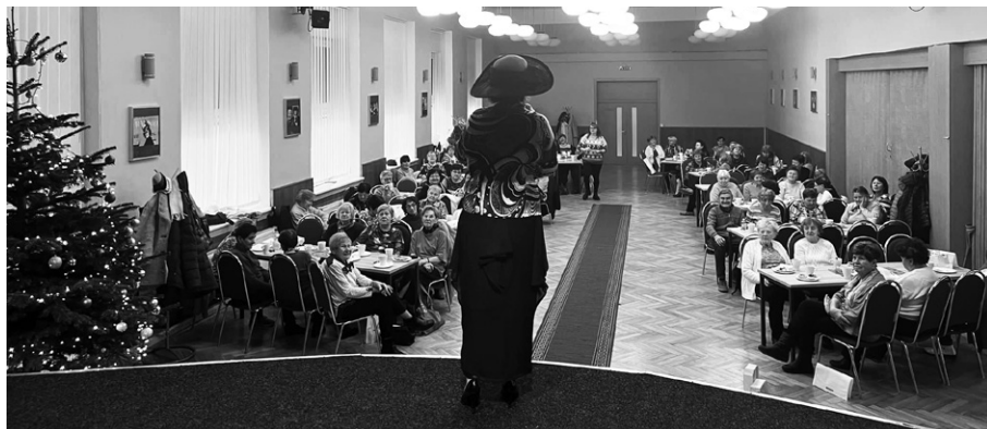
Překvapení! Módní klobouková přehlídka.