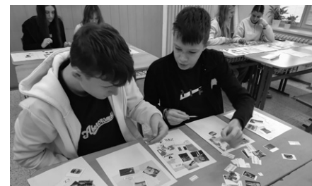
Kolik jazyků umíš, tolikrát jsi Evropan.