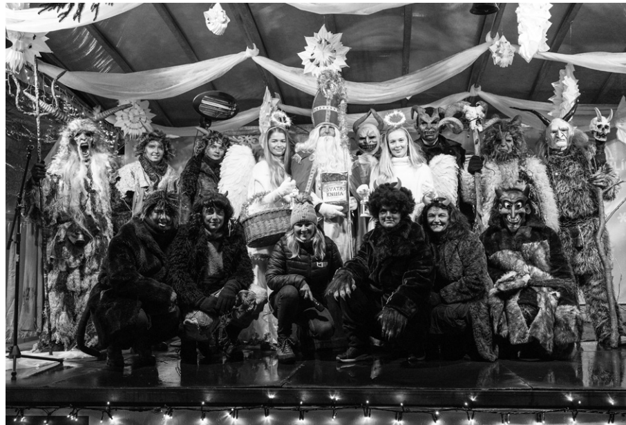
Byla to krásná pohádková sešlost.

dech, když se z pekla ozval rachot řetězů a mezi děti vkročili čerti. Ale nešlo jen o pouhé strašení! Děti si s čerty zahrály partičku karet, a pokud vyhrály, mohly se přesunout do nebe, kde je čekali andílci a Mikuláš. Tam předvedly své básničky nebo písničky, za které byly odměněny sladkostmi.