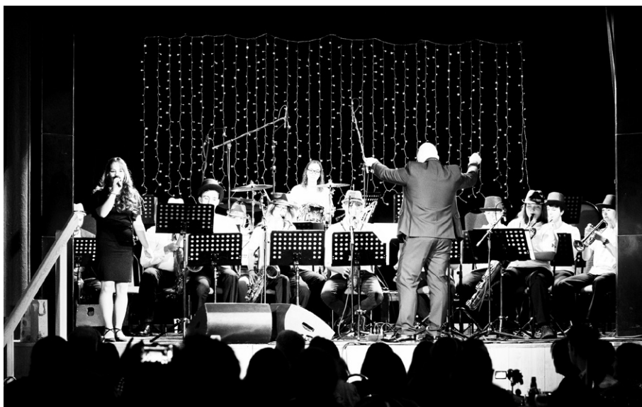
Atmosféra koncertu byla skvělá, posluchačům se ani nechtělo odcházet.

MORAVA si pro své posluchače připravila balíček těch opravdu pravých vánoč-