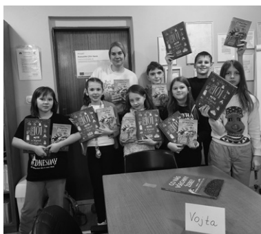
Děkujeme dětem za jejich nadšení pro čtení.