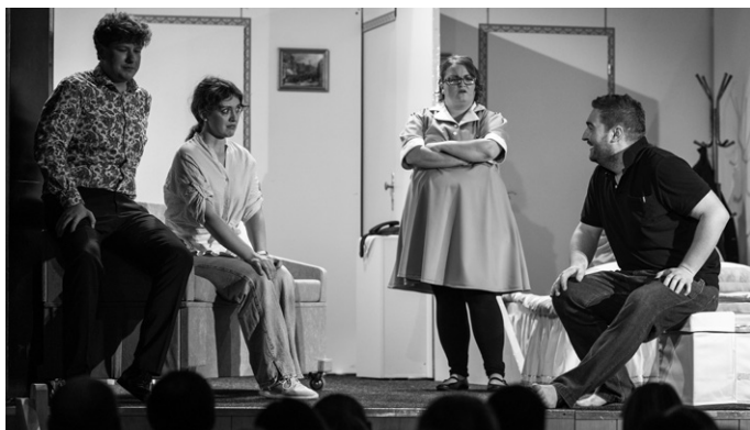
Herci své role nehráli, ale žili do nejmenších podrobností