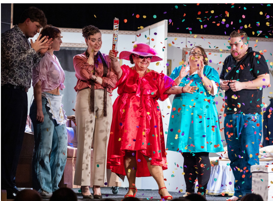
Děj nabídl nejedno překvapení.