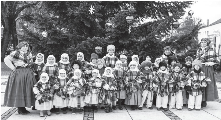
Byla to velká sláva. Děti z Hulíňáčku vystoupily s pásmem Bratři a sestřičky, pojďte na Jesličky .

Závěr roku je pro nás v SVČ Hulín zvláště důležitým obdobím. Děti se sice těší na svítící ozdoby, příchod Ježíška a na štědré Vánoce plné dárků, pro nás je toto období však převážně ve znamení podpory rodinného života a důležitého pouta mezi rodičem a dítětem. Ne že bychom se tím pádem o děti v SVČ starali méně! Aktivit u nás mají více než dost, ale rodinné zázemí nikdy nenahradíme. Abychom tak rodičům trochu usnadnili práci, připravili jsme pro ně adventní kalendář plný zábavných úkolů a podnětů pro společně strávený čas, který snad udělal radost nejen jim, ale i jejich dětem. Mimo tuto individuální aktivitu jsme také u nás poprvé uspořádali předvánoční rodinné focení. Rodiny si přitom nenechaly pouze udělat pěknou památku, ale mohli u nás také chvíli poseďte, namalovat si perníčky, něco pěkného si vyrobit a pohrát si v našich hernách.