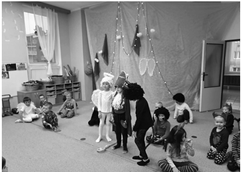
Ve školce tvořivě i pohádkově.

Po vánočních svátcích se znovu setkáváme v mateřské škole. I když venku panuje zima a příroda spí, my neusínáme na vavřínech. Ve všech třídách právě v lednu vr-