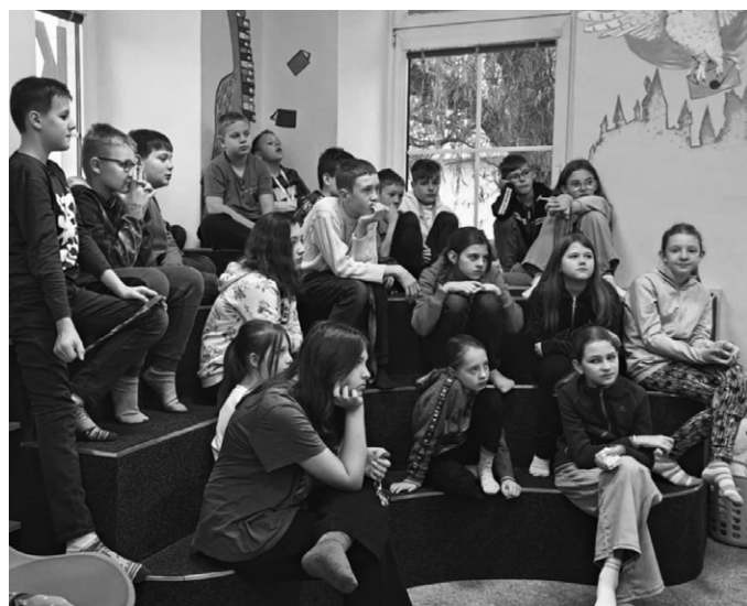
Pátrání vyžadovalo pozornost každého z detektivů.

Třída 5. A navštívila městskou knihovnu, kde pro ně paní knihovnice opět nachystala poutavou besedu. Tentokrát začala netradičně.