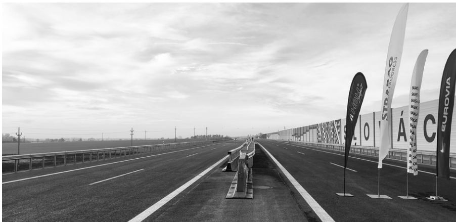
Další úsek dálnice bude impulsem k rozvoji Zlínského kraje.

Porevoluční výstavba D55 se opět neobešla bez chyb, a i přes skutečnost, že její realizační záměr byl schválen v roce 2004 a první posudky a stanoviska k některým úsekům byla vydána v následujícím roce, tak téměř po 20 letech budování jsme měli do roku 2024 hotových jen cca 16 km. Na této situaci se podepsalo zejména promeškání doby tzv. „budovatelského nadšení kapitalismu“, kdy různými rozhodnutími byla výstavba zdržována a došlo k mobilizaci spolků či lidí obecně bránících výstavbě. V některých případech došlo dokonce k propadnutí již vydaných stavebních povolení. A v případě úseku u Napajedel kolem Fatry se čekalo tak dlouho (zpoždění asi 10 let), až řeka Morava vymlela břeh o cca 2 m a nyní dochází k přeprojektování a posunutí trasy.