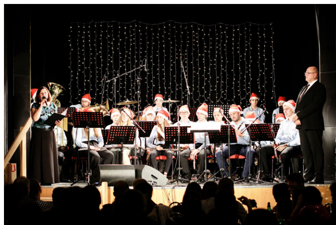
Koncert nabídl v předvánočním čase silný zážitek a krásnou atmosféru.