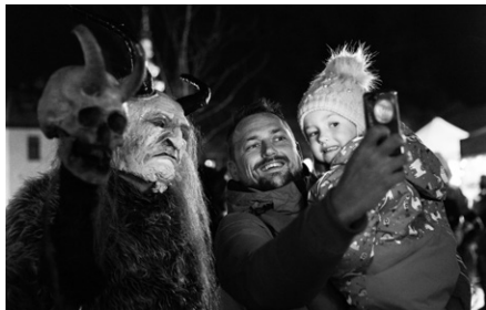
Čerti byli strašidelní, děti hodné

V pátek 6. prosince se náměstí v Hulíně proměnilo v místo plné kouzelné mikulášské atmosféry. Akce „Městem chodí Mikuláš“ přilákala mnoho dětí a jejich rodičů, kteří si užili nezapomenutelný večer v nebeské a pekelné společnosti. Večer zahájil slavnostní příchod Mikuláše doprovázeného zářícími andílky. Všichni však zatajili