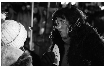
Jakýpak tě čeká osud?

dech, když se z pekla ozval rachot řetězů a mezi děti vkročili čerti. Ale nešlo jen o pouhé strašení! Děti si s čerty zahrály partičku karet, a pokud vyhrály, mohly se přesunout do nebe, kde je čekali andílci a Mikuláš. Tam předvedly své básničky nebo písničky, za které byly odměněny sladkostmi.