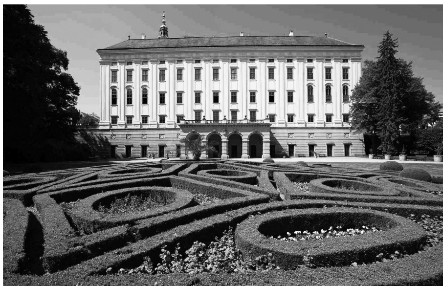
Arcibiskupský zámek k Kroměříži.

Karolína Kovaříková, Správa Arcibiskupského zámku a zahrad v Kroměříži