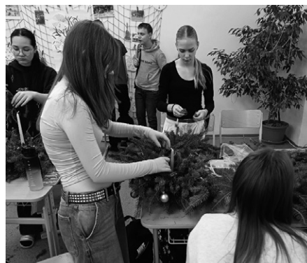
Výrobky byly krásné a...