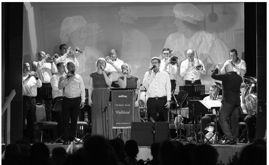
Během programu zazněla řada skladeb různých žánrů.