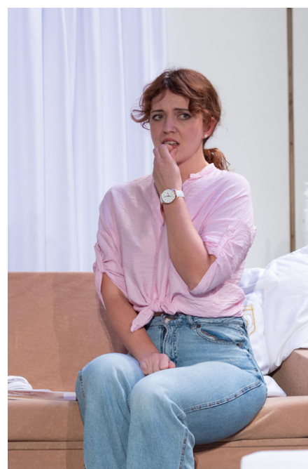
Tak bude ta (dokonalá) svatba?