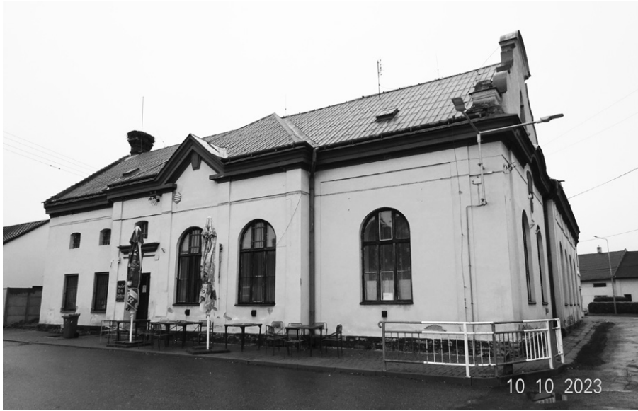
V letošním roce začnou opravy hostince U Čápa v Záhlinicích.

V úvodu prvního stavebního okénka roku 2025 se musím omluvit za posun otevření nového kulturního centra. Všichni jsme se těšili, že letošní sezónu zahájíme v rekonstruované Sokolovně. Nicméně při kontrole požárního zabezpečení budovy byly odhaleny nedostatky, které vznikly chybami v projektové dokumentaci. Vše se musí nyní odstranit a následně můžeme požádat o novou kontrolu a kolaudaci, což nám zabere minimálně dva měsíce. Předpokládám, že bychom mohli kulturní centrum otevřít v průběhu měsíce března.