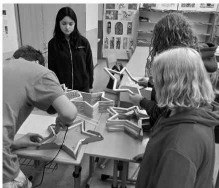
Žáci ukázali velkou šikovnost