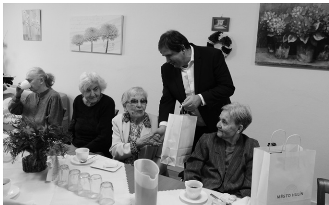
Setkání a dárky z Hulína vždy potěší