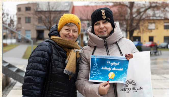
Šlo už o osmý ročník soutěže, ocenění je prestižní