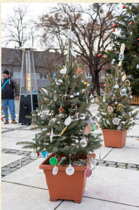
Předškoláci z Jeslí Hulín v hlasování zabodovali