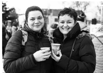
Advent je časem pro setkávání a sdílení radostí

Poslední adventní neděle patřila koncertu „Živý klavír“, který na náměstí vykouzlil nezapomenutelnou atmosféru. Za zvuků klavíru, saxofonu, zpěvu a houslí