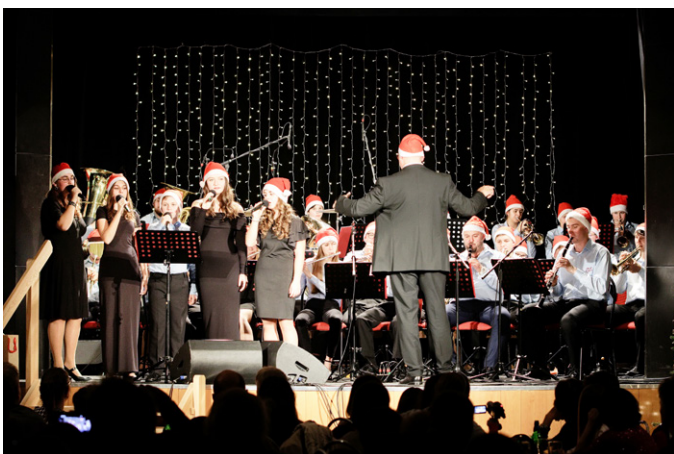
Když Adventní koncert, tak i s červenými čepičkami