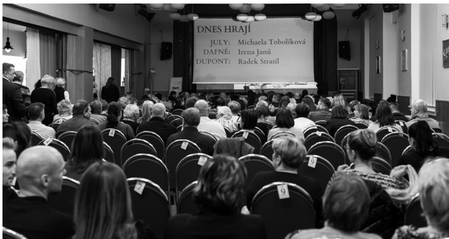
Představení sledoval zcela zaplněný sál MKC