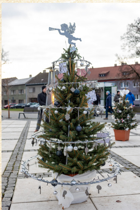
Stromeček od firmy Pilana Wood Hulín byl jednoznačným vítězem