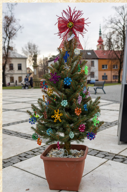
Také stromeček Spolku zdravotně postižených Hulín se líbil