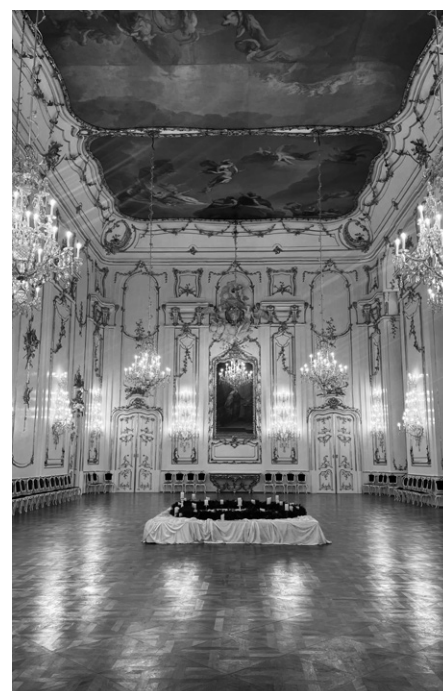
Interiéry zámku jsou plné historických skvostů.

K novinkám letošního roku patřil také nový okruh „VIA MAGNIFICA“, který návštěvníky vede obrazárnou, nově otevřenou soukromou kaplí svatého Šebestiána a Manským sálem. Na své si zde přijdou i milovníci numismatiky. Na trase se totiž nachází kabinet mincí, který nabízí to nejlepší ze sbírky, která je srovnatelná jen se sbírkou z vatikánských muzeí. Součástí trasy je i jedinečná Stará knihovna, která je sama o sobě komplexním, svébytným a po umělecké stránce hodnotným prostorem. Vstup do Obrazárny nově ozdobily stély, které jsou dílem olomouckého rodáka a dnes již mezinárodně uznávaného sochaře Ivana Theimera. Mezi velké novinky v Obrazárně patří takzvaný Mamlúcký koberec, který je i ve světovém kontextu velmi ojedinělým a mimořádně cenným dílem z počátku 16. století. Návštěvníkům jsme nově nabídli audio průvodce, díky nimž se příchozí mohou o těchto výjimečných a umělecky cen-