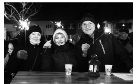
Kouzelnou atmosféru umocnily prskavky

Ekologická likvidace autovraků ZDARMA. Včetně potvrzení na místě.