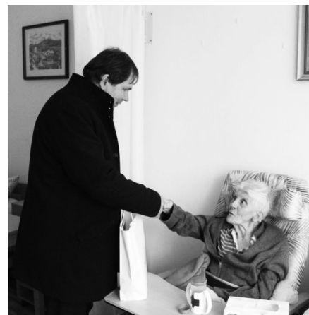
Radnice na své občany nezapomíná, setkání v domovech pro seniory jsou tradicí