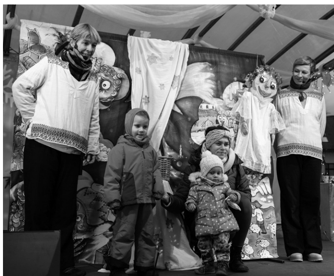
Během adventu bylo na náměstí Míru veselo