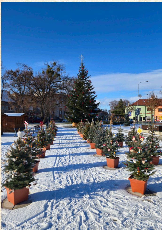
Hlasující tentokrát hodnotili 28 nazdobených stromečků.

Tradiční soutěž O nejhezčí hulínské stromeček slavila letos již svůj osmý ročník. Soutěžící stromečky zdobily náměstí po celý advent a přilákaly stovky hlasujících.