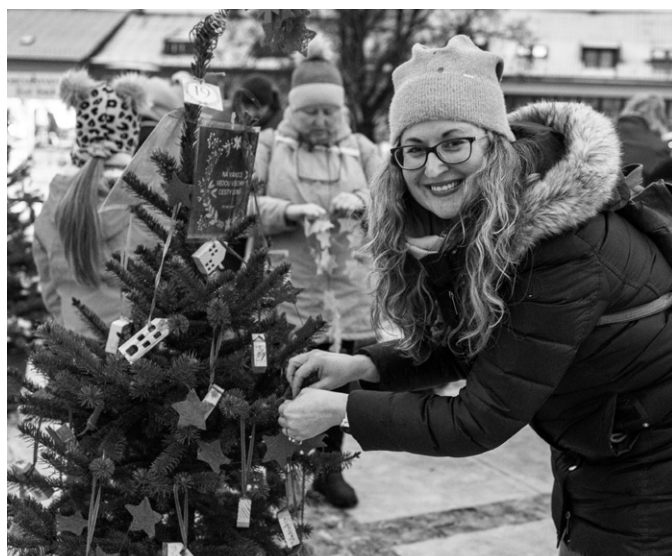
Soutěž o nejhezčí vánoční stromeček přilákala mnoho zájemců.