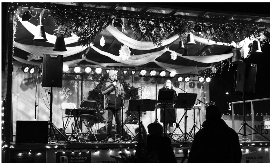
Zpívaly se ty neznámější české koledy.

a Jany Lukášové Mrazíkové, který nás naladil na tu pravou vánoční notu. Děkujeme všem, kdo jste přišli, za úžasný večer plný pohody a společného sdílení tradic. Už teď se těšíme na příští rok! (ek)