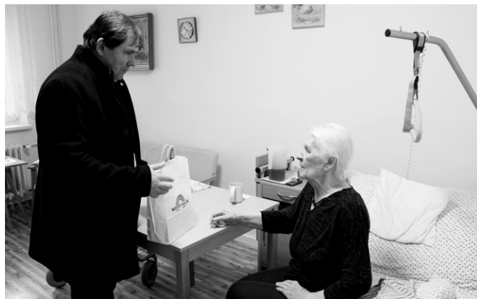
Pohovořit, popřát, užít si návštěvu.