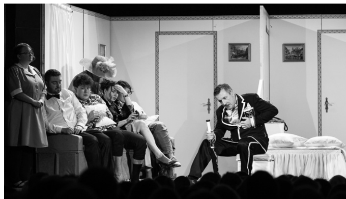
Kostýmy nápadité, šité na míru, krásná scéna