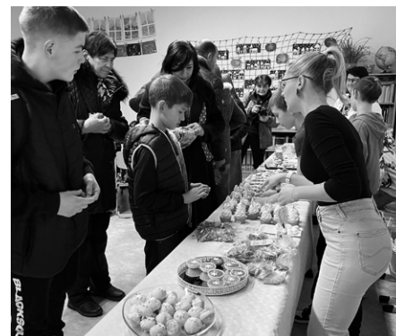
...rychle mizely ze stolů.