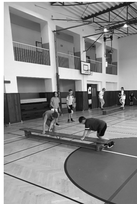
Fitness může být skutečně zábavné.